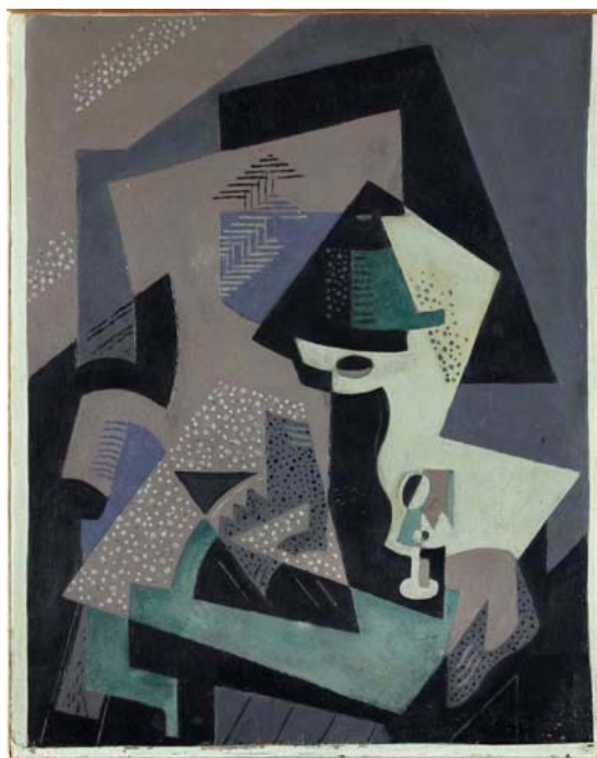
MARÍA BLANCHARD Composición cubista-Naturaleza muerta verde con lámpara, 1916-1917 Óleo sobre lienzo 92 x 72 cm Colección LL-A. Madrid