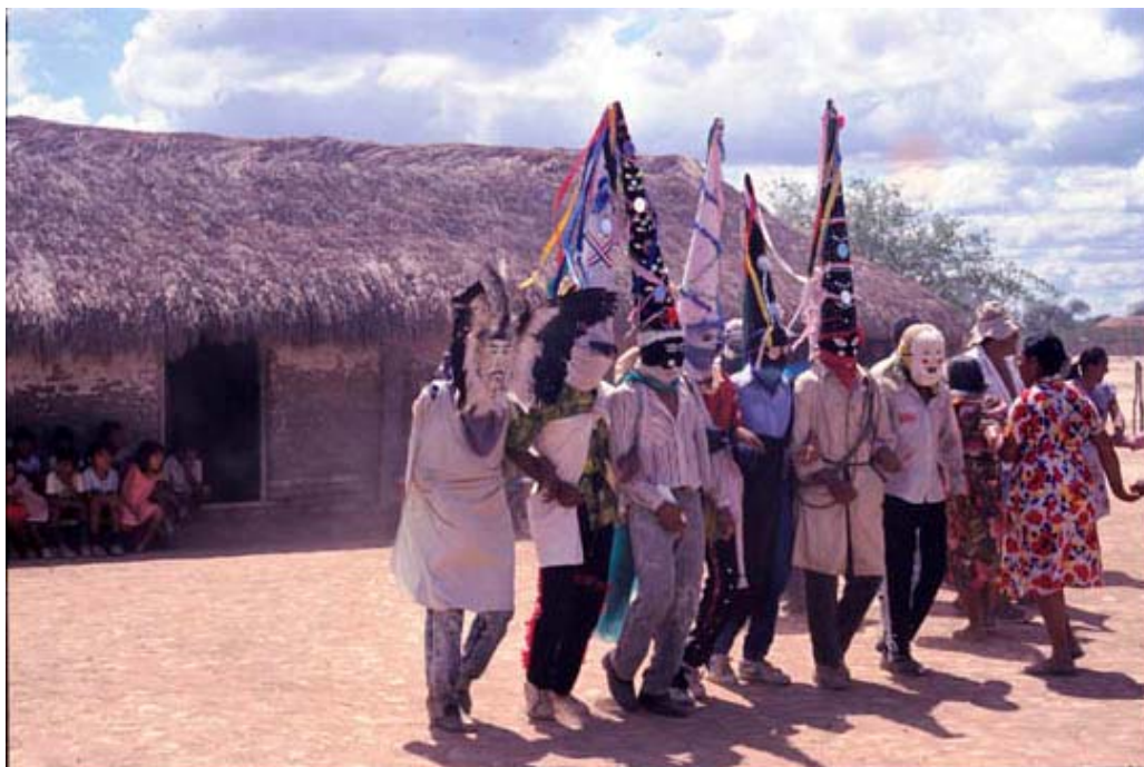
Arete Guasu. Ritual chiriguano. Santa Teresina, 1993.