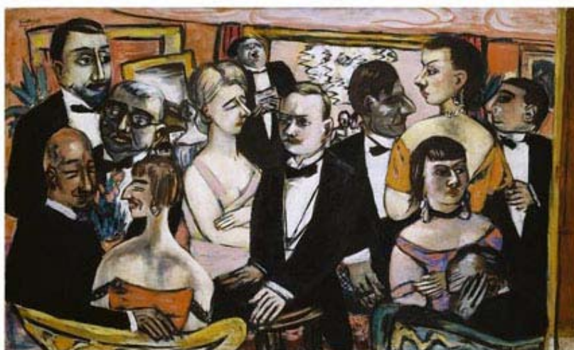
MAX BECKMANN - Gesellschaft Paris , 1931 Óleo sobre lienzo 43 x 69 cm Solomon R. Guggenheim Museum, Nueva York