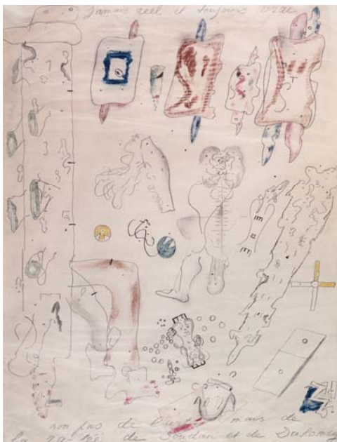
ANTONIN ARTAUD Jamais réel et toujours vrai...ca. enero de 1945 Grafito y lápiz graso 64 x 48 cm Musée Cantini, Marsella © Antonin Artaud, VEGAP, Madrid, 2012