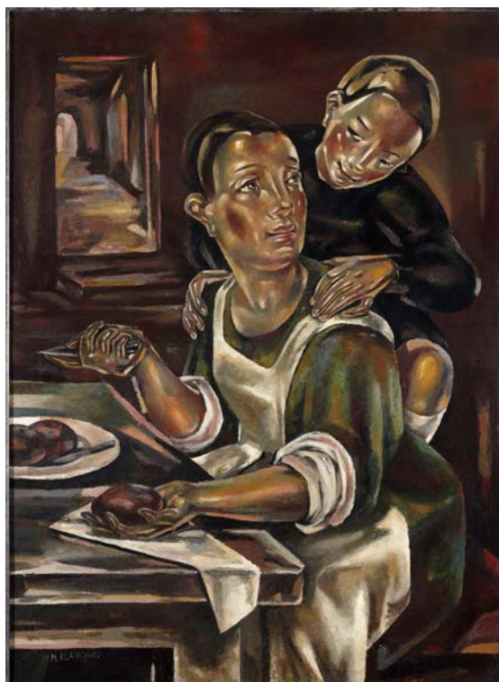
MARÍA BLANCHARD La cocinera, 1924 Óleo sobre lienzo 80 x 65 cm Colección privada. Santander