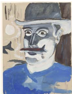
Apollinaire, 1904 Acuarela y gouache sobre papel 31,9 x 23,8 cm Rijksmuseum, Amsterdam. Tranfer Instituut Collectie Nederland, 2008

El próximo jueves, 20 de octubre , tendrá lugar la presentación a los medios de comunicación de una retrospectiva dedicada al artista holandés René Daniëls (Eindhoven, 1950), que ha sido organizada por el Museo Nacional Centro de Arte Reina Sofía y el Van Abbemuseum de Eindhoven (Holanda). El acto tendrá lugar a las 12:00h, en el Palacio de Velázquez (Parque del Retiro) , y contará con la asistencia del propio artista , así como del comisario de la exposición, Roland Groenenboom , y del director del Museo Reina Sofía, Manuel Borja-Villel .