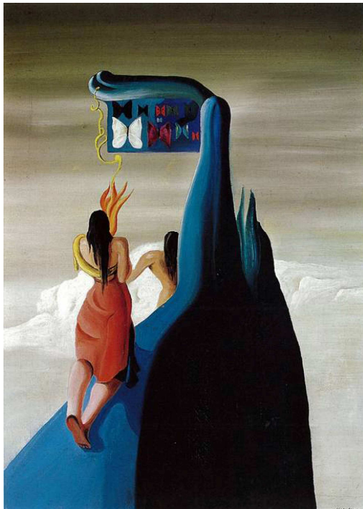
Óscar DOMÍNGUEZ Mariposas perdidas en la montaña , 1934 Óleo sobre lienzo 60 x 45 cm.