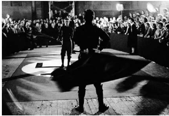
Che cos'è il fascismo

Suolo , 2008, vídeo, color, sonido, 14'50". Cortesía Magazzino d'Arte Moderna, Roma.