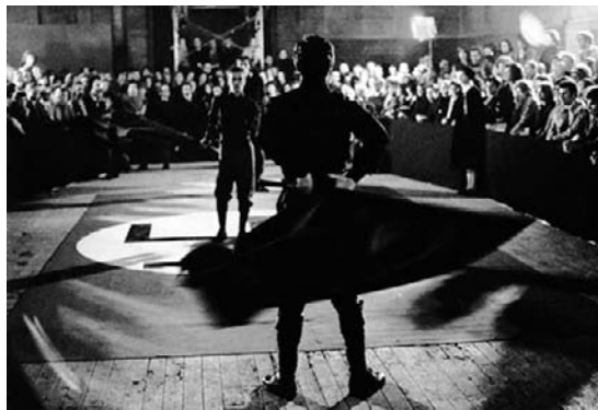
Che cos'è il fascismo

Suolo , 2008, vídeo, color, sonido, 14'50".