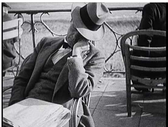
Jean Vigo. À propos de Nice (A propósito de Niza). Película, 1930, VO, b/n, 23'

Jean Vigo. À propos de Nice (A propósito de Niza)