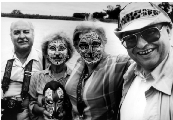
Dennis O'Rourke. Cannibal Tours . Película, 1988, VOSE, color, 67'

Dennis O'Rourke. Cannibal Tours 1988, VOSE, color, 67'