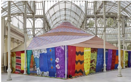
FEDERICO GUZMÁN Tuiza, 2015 Estructura, melifas pintadas para los laterales (230 x 120 cm c/u aprox.), telas triangulares de benia para el techo, 10 colchonetas forradas con tela, alfombras, mobiliario, archivo de las actividades de la Tuiza (disco duro con fotografías y vídeos) Medidas totales: 550 x 900 x 900 cm.

Federico Guzmán (Sevilla, 1964) es el autor de Tuiza , (2015) una instalación a modo de Jaima compuesta por melifas pintadas, telas triangulares de benia para el techo, colchonetas, alfombras y mobiliario, todo ello acompañado de un archivo de las actividades de la Tuiza (disco duro con fotografías y vídeos). Esta estructura efímera, que se produjo en 2015 para la exposición Tuiza, organizada por el Reina Sofía y fue expuesta en el Palacio de Cristal, es una de las obras