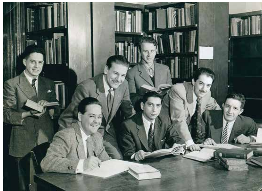
Primer grupo de estudiantes chilenos que viaja a la Universidad de Chicago (1956) para cursar estudios de economía bajo la enseñanza de Milton Friedman