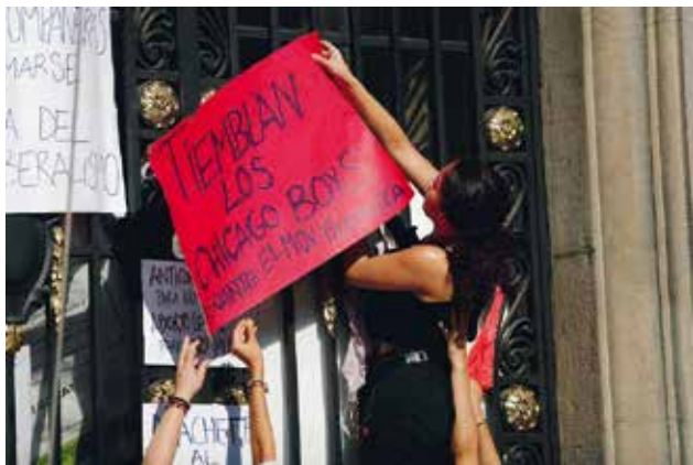
Toma feminista de la Pontificia Universidad Católica de Santiago de Chile, mayo de 2018

Esta insurgencia feminista no solo remeció la arquitectura patriarcal de los poderes instituidos (religiosos, culturales, sociales y políticos) que había seguido normando la transición chilena, también propagó por la sociedad entera el impulso libertario de experimentar colectivamente un mundo que rompiese sus ataduras. Uno de los carteles aparecidos en mayo de 2018 durante la toma de la Pontificia Universidad Católica en Santiago de Chile (una Universidad cuya Escuela de Economía convirtió al neoliberalismo en dogma) decía: “Tiemblan los Chicago Boys. Aguante el movimiento feminista”. Este cartel feminista nos recuerda que nunca es tarde para que ciertas pulsiones emancipatorias fisuren el bloque de una hegemonía neoliberal (la de los Chicago Boys) instaurada más de cuarenta años atrás, haciendo un llamado de futuro que deberá completarse mediante el entrecruzamiento plural de expansivas voluntades de cambio.