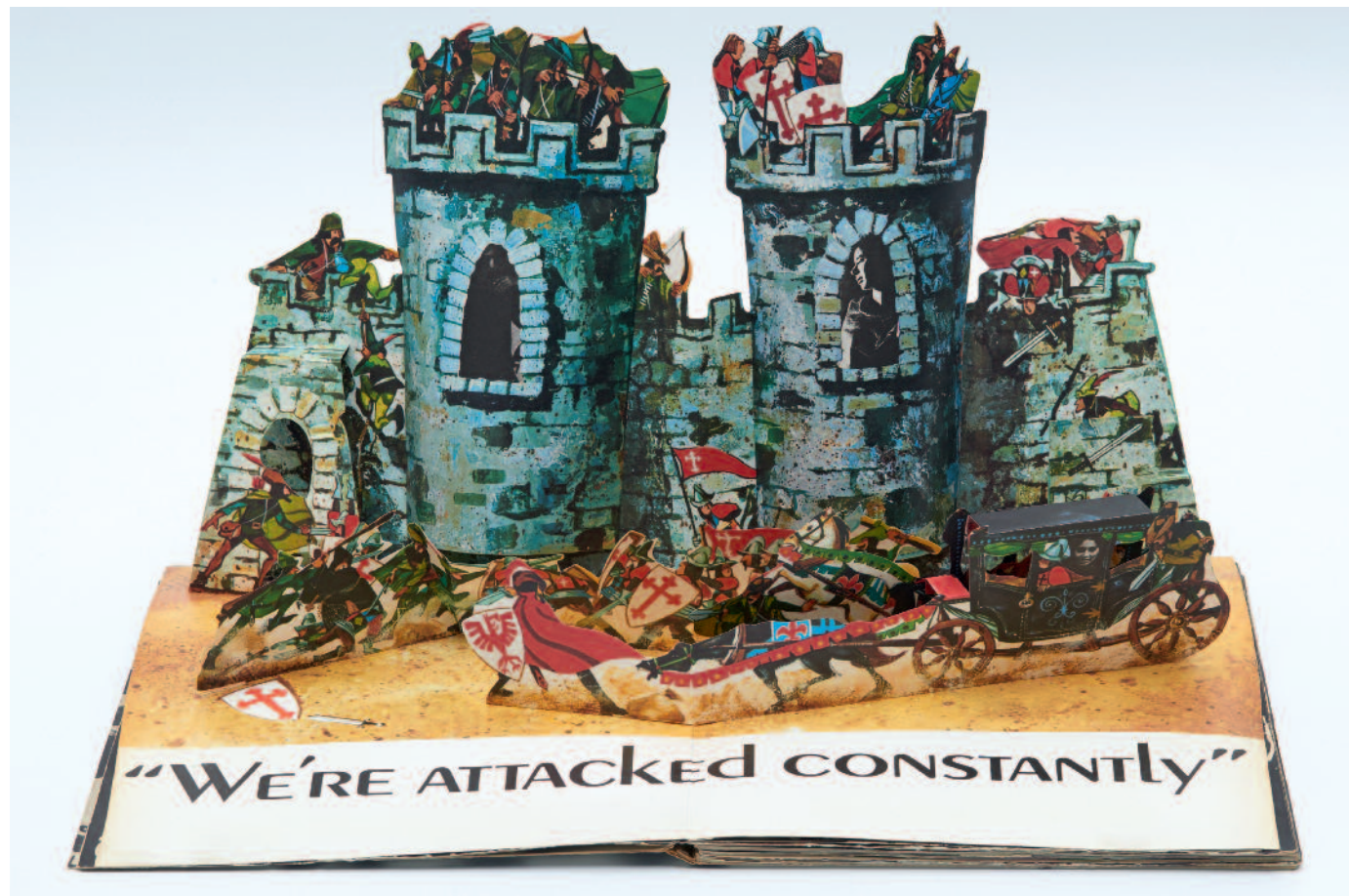
Andy Warhol, Andy Warhol's Index (Book) , Nueva York: Random House, 1967. Museo Nacional Centro de Arte Reina Sofía © The Andy Warhol Foundation for the Visual Arts, Inc./VEGAP, Madrid, 2016

En estos libros, la apariencia, el contenido o el objetivo del libro convencional se utilizan como modelos para su transformación en una nueva representación, de manera parecida, por ejemplo, a cuando se toma un cuerpo como referencia para un cuadro o una escultura. A veces, el modelo es reconocible; otras, aparece subvertido. Las posibilidades de metamorfosear un libro van de la página suelta