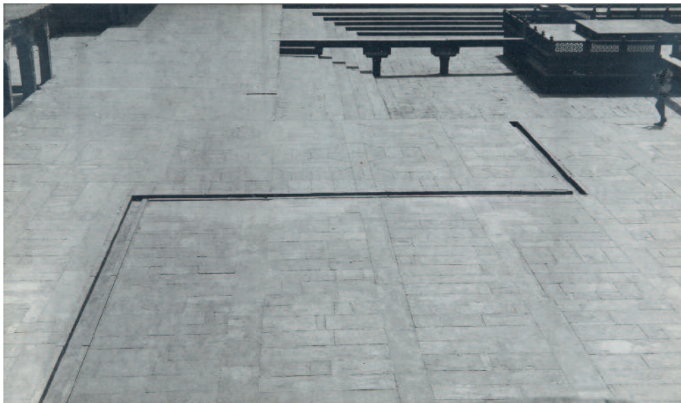
Sin título , ca. 1972. Fotografía b/n, copia de época. Gelatinobromuro de plata, 19,6 x 33,6 cm. Kiran Nadar Museum of Art, Nueva Delhi

En 1954, Mohamedi ingresó en la St. Martin's School of Art de Londres para estudiar Bellas Artes. En sus primeros bocetos y dibujos se reafirma el rechazo a la representación antropomórfica. En las contadas ocasiones en que intentó captarla ofrece escasos detalles que revelan su falta de interés por la plenitud corpórea de la figura humana. Experimentó con diversos medios, pero atendiendo en todo momento a un impulso que la condujo a la abstracción. En 1961 obtuvo una beca del gobierno francés para estudiar artes gráficas en París. La obra de Paul Cézanne, Paul Klee, Wassily Kandinsky y Kazimir Maléovich le sirvió de inspiración, además de los peculiares ideogramas de Henri Michaux y la abstracción lírica de Georges Mathieu. Después de pasar algún tiempo en Londres, París, Bombay, Bahrein y Kuwait, recaló en la ciudad india de Baroda, donde trabajó como profesora en la Facultad