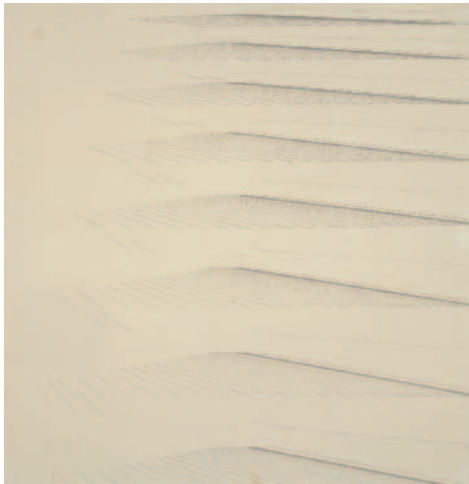
Sin título, ca. 1975. Tinta y grafito sobre papel, 47,4 x 47,4 cm Kiran Nadar Museum of Art, Nueva Delhi

Mohamedi desarrolló un trabajo fotográfico paralelo, aunque nunca expuso sus fotografías en vida. Sus primeras instantáneas subrayan el interés por el encuadre de las composiciones. Elementos lineales, motivos repetitivos, tales como postes telefónicos o farolas, se alejan a lo largo de un camino e invitan al observador a perderse en la remota distancia. Mohamedi capta el contraste entre las curvas y las rectas en las formas arquitectónicas y en las vallas, o el modo en que la acción de la luz confiere una sensación de profundidad a las formas circulares. En las fotografías semi-abstractas de telares, los hilos se tratan como si fueran líneas cuya tensión evoca a veces el macillo de un instrumento musical.