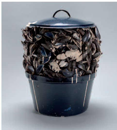
Moules sauce blanche [Mejillones con salsa blanca], 1967 Colección particular, Nueva York

1958, con la que rinde homenaje a la figura de Kurt Schwitters, también poeta y artista visual, que había sabido situarse en las lindes del mercantilismo y la cultura. En esta cinta, rodada en el Palais des Beaux-Arts de Bruselas, con motivo de una retrospectiva itinerante del artista alemán, Broodthaers experimenta con la forma inconclusa del ensayo, el anacronismo del blanco y negro, y reúne los lenguajes de la poesía, las artes plásticas y el cine, sobre los que vuelve en sucesivas ocasiones.