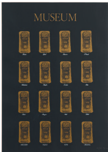
Museum-Museum [Museo-Museo], 1972. Colección MACBA, Fundación MACBA

museo y su posición de autoridad, al mismo tiempo que reivindica el potencial disruptivo del objeto artístico y advierte sobre los peligros de su asimilación y legitimación por parte de las estructuras dominantes. Precisamente, este museo ficticio cierra cuando obtiene el reconocimiento institucional de la documenta 5, la exposición de arte contemporáneo celebrada en Kassel en 1972.