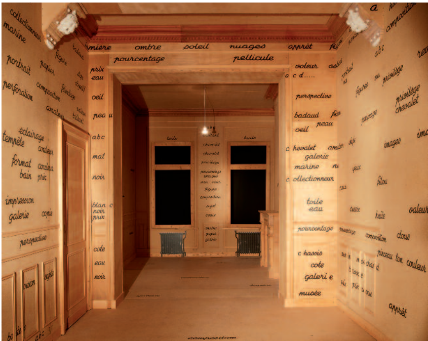
Salle blanche [Sala blanca], 1975. Centre Pompidou, París. Musée national d’art moderne. Centre de création industrielle. Vista de la exposición Marcel Broodthaers. Una retrospectiva . Museo Nacional Centro de Arte Reina Sofía, Madrid

Con su Musée d’Art Moderne. Département des Aigles , más que una obra, Broodthaers perfila nuevos márgenes para la creación artística. Desvela la naturaleza discursiva del