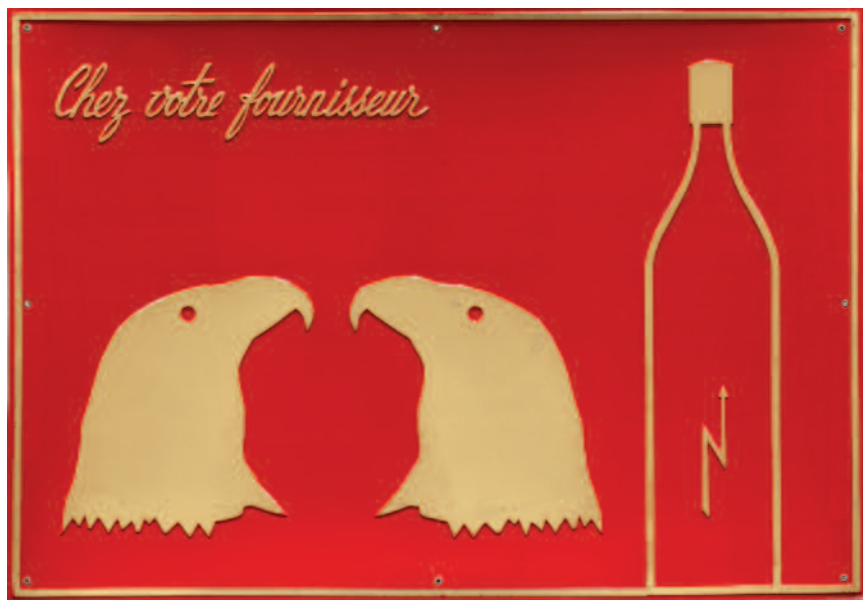
Chez votre fournisseur (Le Vinaigre des Aigles) [En su proveedor habitual (Vinagre de águilas)], 1968 Museo Nacional Centro de Arte Reina Sofía, Madrid

cuando cuenta con cuarenta años, anuncia su incursión en las artes visuales e inaugura su primera exposición en la Galerie Saint Laurent de Bruselas para la que incrusta en yeso su poemario, Pense-Bête [Recordatorio, 1964]. También en esa fecha, Magritte le hace llegar un ejemplar de Un coup de dés jamais n'abolira le hasard [Un golpe de dados jamás abolirá el azar, 1897] de Mallarmé, que Broodthaers interviene más adelante, en 1969, transformando las palabras escritas en franjas negras, sustituyendo el subtítulo de “poesía” por el de “imagen” y la firma del poeta por la suya. Su intención no es abandonar la poesía, sino extenderla a nuevos horizontes, formales y conceptuales, como evidencian sus exposiciones literarias Le Corbeau et le Renard [El cuervo y el zorro, 1967 y 1968] y Marcel Broodthaers à la De-