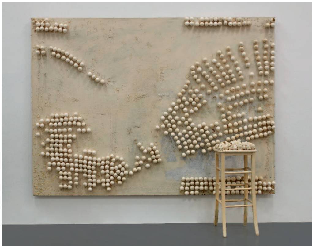
Tableau et tabouret avec oeufs [Cuadro y taburete con huevos], 1966

Museo Nacional Centro de Arte Reina Sofía, Madrid