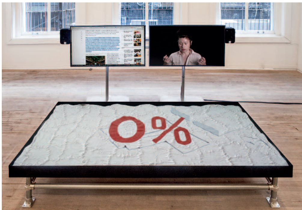
Duty-Free Art , 2015. © Hito Steyerl, VEGAP, Madrid, 2015

MUSEO NACIONAL CENTRO DE ARTE REINA SOFIA