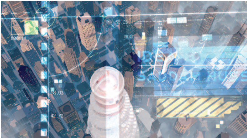
La torre , 2015. © Hito Steyerl, VEGAP, Madrid, 2015