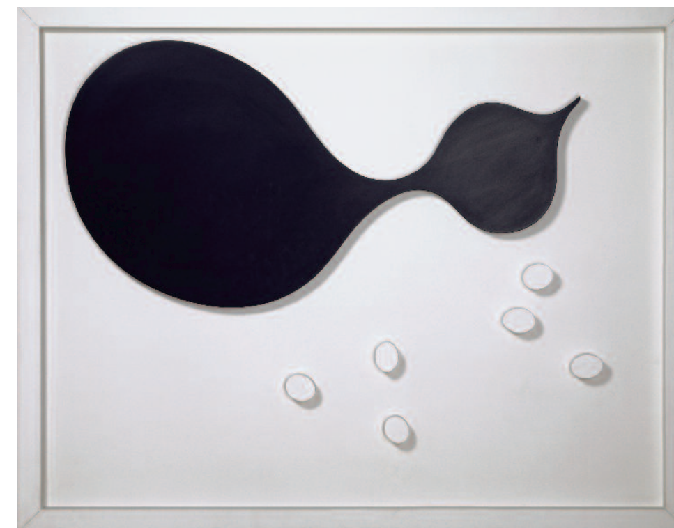
Hans Arp. Flèche de nuage [Flecha de nube], 1932. Madera tallada y pintada Kunstmuseum Basel, donación de la colección Oskar y Annie Müller-Widmann en 1965