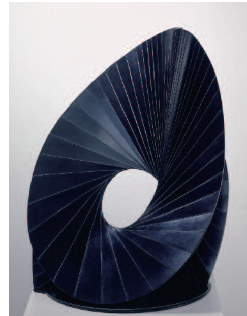
Antoine Pevsner Construction surface développable [Construcción con superficie desarrollable], 1938. Cobre Kunstmuseum Basel, donación de la colección Oskar y Annie Müller-Widmann en 1965

La obra de Paul Klee, nacido en Suiza, marca uno de los puntos fuertes de la pinacoteca a par-