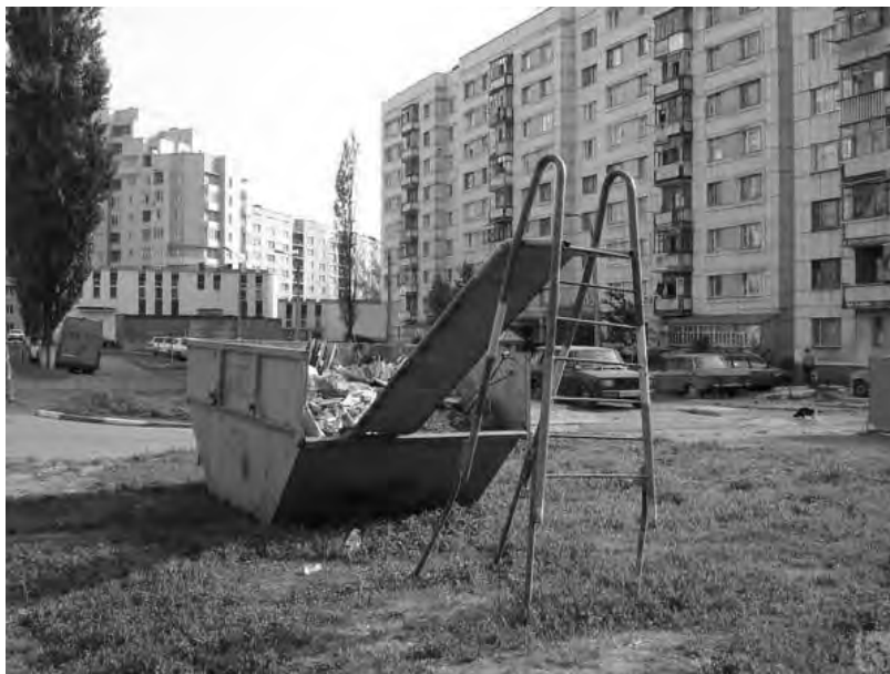
Sad Playground, como lo encontró Peter Fischli en la World Wide Web, 2013

La exposición aborda el potencial socializador, transgresor y político del juego cuando aparece vinculado al espacio público. Desde la tradición popular del carnaval se reconoce la posibilidad de subvertir, reinventar y trascender, aunque sea temporalmente, lo cotidiano devenido en mero ejercicio de supervivencia. El reconocimiento de la existencia de una comunidad de bienes y la necesidad de tiempo libre, en contraposición directa al tiempo de trabajo, constituyen dos constantes fundamentales del imaginario utópico a lo largo de la historia. El espacio público, como ámbito que sintetiza la noción de comunidad de bienes, se materializa en la experiencia de la participación ciudadana.