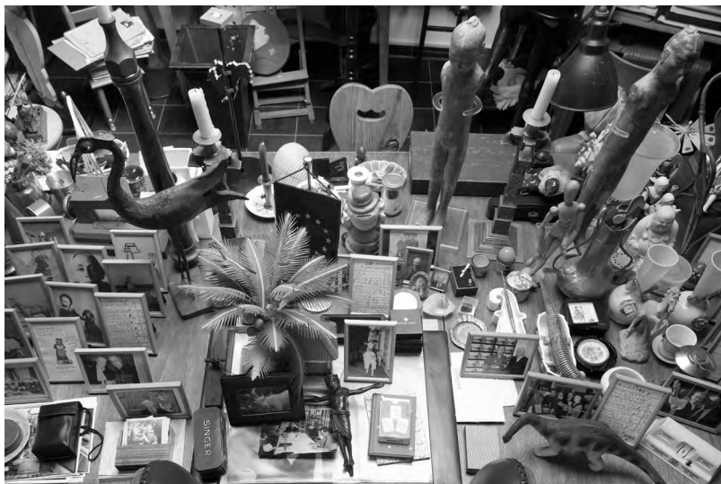
Detalle de una mesa en la casa-estudio de Hanne Darboven. Cortesía Fundación Hanne Darboven.

Hanne Darboven (Múnich, 1941 – Hamburgo, 2009) vivió toda su vida en Am Burgberg, su casa familiar de Hamburgo, donde había instalado también su estudio, a excepción de una estancia de dos años en Nueva York a mediados de la década de los sesenta. Su casa-estudio está repleta de obras propias y regalos de amigos artistas, pero sobre todo de objetos de uso cotidiano, artesanía, souvenirs, chismes de toda clase y curiosidades de todos los rincones del mundo. Recuerda más bien un gabinete de curiosidades que un estudio al uso.