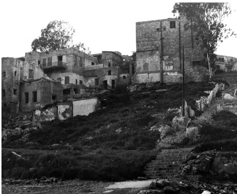
Wadi Salib (Haifa), ca. 1998

Las biografías de Amos Gitai puede ser considerada como estudio de un caso concreto en el marco de la investigación propuesta por la exposición Formas biográficas. Construcción y mitología individual . Amos Gitai, nacido en Haifa en 1950, ha consagrado recientemente dos películas a sus padres, Carmel (2009) y Lullaby to My Father (Nana para mi padre, 2011). Su madre (1909-2004) había nacido en Jaffa de padres rusos; su padre (1909-1970), arquitecto formado en la Bauhaus, había huido de la Alemania nazi en 1933.