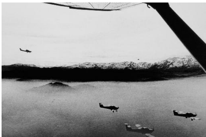
iAy Sudamérica! , 1981, C.A.D.A., Museo Reina Sofía