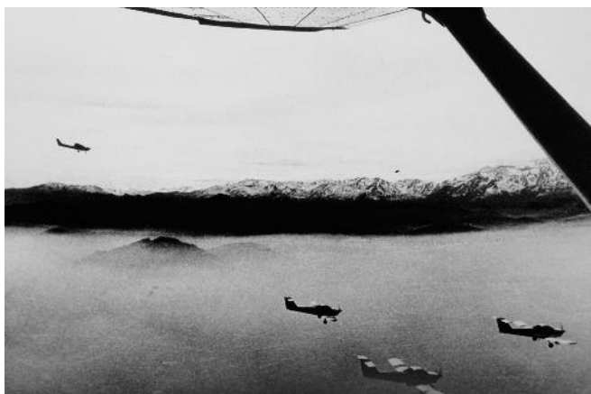
iAy Sudamérica! , 1981, C.A.D.A., Museo Reina Sofía