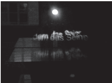
Maja Bajevic. To Be Continued (Continuará), 2011, instalación.

Este aparece rodeado por andamios que lo sitúan en un tiempo intermedio, entre la construcción y el desmontaje. En la parte trasera hay un tobogán, de tal modo que la única forma de descender del monumento es o dar la “vuelta” y bajar por donde se ha venido, o bien tirarse por el tobogán. Ambas opciones