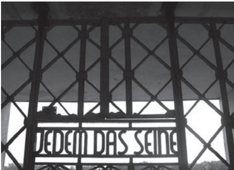
Jedem das Seine (A cada uno lo suyo), lema en la puerta del campo de concentración de Buchenwald

Despertar a la Bella Durmiente / ponerla en movimiento / noche y día