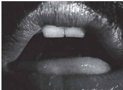
Eat me [Cómeme], 1975 16 mm / 35 mm, color, sonido, 6'41'' Projeto Lygia Pape

fuerza motriz individual en un pretexto para la movilización colectiva. Roda dos prazeres incita a una toma de conciencia de los sentidos: un pretexto para saborear y teñirse la lengua de distintos colores.