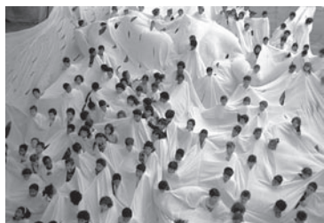
Divisor , 1968 Museu de Arte Moderna, Río de Janeiro, 1990. Fotografía color 12,4 x 18,5 cm Projeto Lygia Pape

La disolución del Grupo Frente en 1963 marca un punto de inflexión en la trayectoria de Lygia Pape, quien inicia entonces sus colaboraciones con el Cinema Novo. En 1964 la dictadura militar toma las riendas del poder durante los siguientes veinte años. Un presente cada vez más negro determina el proyecto cultural tropicalista de alcance multidisciplinar y colectivo. La urgencia de una nueva estética canaliza un deseo de denuncia y de emancipación cultural que esgrime el Manifesto Antropófago de Oswald de Andrade (1928) y la vitalidad de la cultura popular.