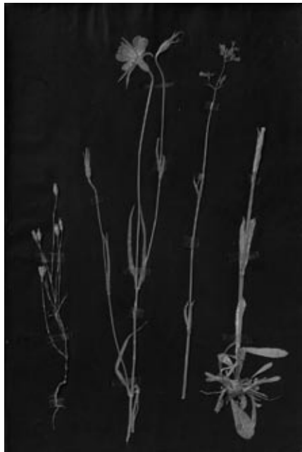
Paul Klee. Pflanzen auf schwarz grundier- tem Papier [Plantas sobre papel con imprimación negra], ca. 1930. Plantas sobre papel con imprimación, 46,4 x 30,4 cm. Zentrum Paul Klee, Bern. Donación de la familia Klee

níamos que había fronteras. Arthur Rimbaud recortó un día un atlas geográfico para consignar su iconografía personal con los trozos obtenidos. Más tarde, Marcel Broodthaers, On Kawara o Guy Debord inventaron muchas formas de geografías alternativas. Aby Warburg, por su parte, ya había entendido que cualquier imagen –cualquier producción de la cultura en general– es un cruce de múltiples migraciones : es en Bagdad, por ejemplo, donde buscaría los significados inadvertidos de algunos frescos del Renacimiento italiano.