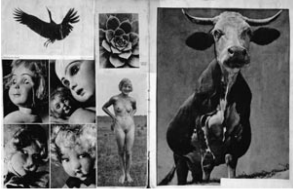
Hannah Höch, Album [Álbum], 1933. Collage con recortes de prensa, 36 x 28 x 3 cm. Berlinische Galerie - Landesmuseum für Moderne Kunst, Fotografie und Architektur

Atlas, finalmente, dio su nombre a una forma visual de conocimiento : al conjunto de mapas geográficos reunidos en un volumen, generalmente en un libro de imágenes, y cuyo destino es ofrecer a nuestros ojos, de manera sistemática o problemática –incluso poética a riesgo de errática, cuando no surrealista– toda una multiplicidad de cosas reunidas allí por afinidades electivas , como decía Goethe. El atlas de imágenes se convirtió en un género científico por derecho propio a partir del siglo XVIII (pensemos en el libro de láminas de la Encyclopédie ) y se desarrolló considerablemente en los siglos XIX y XX. Encontramos atlas muy serios, muy útiles –generalmente muy bonitos– en el ámbito de las ciencias de la vida (por ejemplo los libros de Ernst Haeckel sobre las medusas y otros animales marinos); existen atlas más hipotéticos, por ejemplo en el ámbito de la arqueología; también tenemos atlas totalmente detestables en el campo de la antropología y la psicología (por ejemplo el Atlas del hombre criminal de Cesare Lombroso o algunos de los libros de fotografías «raciales» constituidos por pseudo-eruditos del siglo XIX).