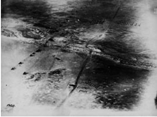
Aby Warburg. War photographs [Fotografías de guerra], 1914-1918. Fotografía en blanco y negro, dimensiones variables.