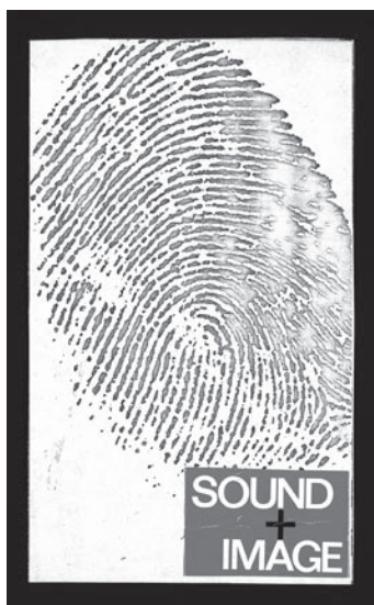
Sin título, ca. 1977 - 1982. Collage sobre papel. 27 x 16 cm.

Otros documentos expuestos hacen referencia a otras de sus actividades en el periodo republicano y durante la Guerra Civil. Y, ya con un salto de más de veinte años de por medio, también se incluye una recuperación archivística y parcial de Festivales de España , una serie de cortos documentales en la que trabajó en los años 1963-1964 (sin llegar a terminar su montaje y sonorización), con la que Val del Omar –pero no sólo él– creyó revivir el espíritu de las Misiones Pedagógicas.