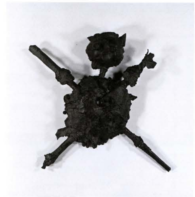
Tar Baby / Bebé de alquitrán, 1975-1976. Bronce, 33 x 36 x 4 cm Sammlung Falckenberg, Hamburg

cubren su cuerpo desnudo simbolizan a sus amigos y futuros colaboradores, con quienes realizará hasta 1973 distintos work in progress (obras en proceso) para diversas instituciones europeas.