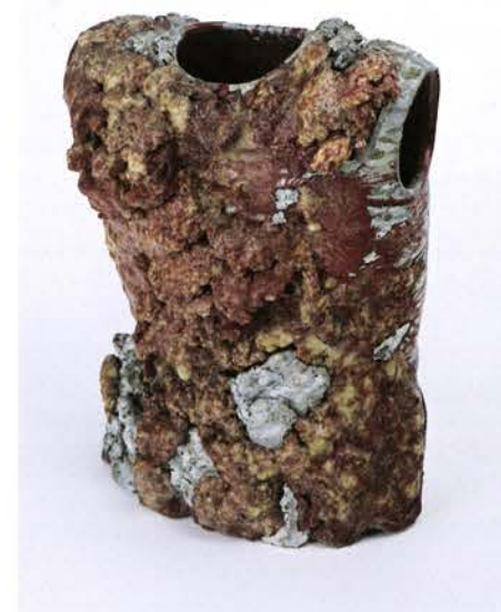
La Corazza di Michelangelo / La coraza de Miguel Ángel, ca. 1963 Cera y acrílico sobre yeso 40 x 30 x 20 cm Sammlung Falckenberg, Hamburg

Ese mismo año crea en Ámsterdam su obra Fishman (Hombre-pequeño), de nuevo un alter ego a partir de un molde de su cuerpo, aunque en este caso el artista muerto resucita simbólicamente. Utiliza la imagen de un submarinista para describir su papel como artista, mientras los peces que