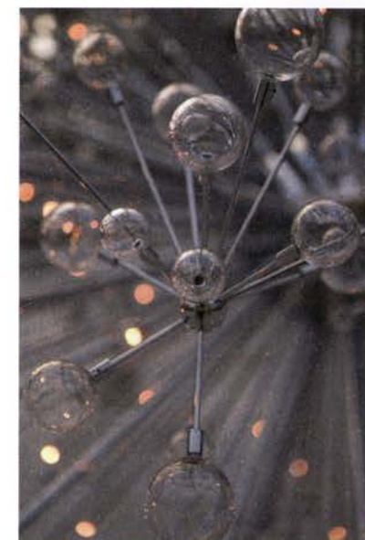
Island Universe (Universo Isla), 2008. © Josiah McElheny.

El Palacio de Cristal constituye un marco especialmente idóneo para la obra de McElheny, con la que comparte connotaciones tanto estéticas como simbólicas. Construido en 1887 como sede de una exposición dedicada a Filipinas, entonces colonia española, forma parte de ese legado moderno, racionalista, al que remiten tanto su arquitectura estructural en vidrio y metal como su primera función, de invernadero para la flora filipina. Cerca de él se encuentra el Observatorio astronómico. Los dos edificios representan la fe en el progreso y el orgullo por los logros científico – políticos que caracterizan la modernidad, y que la posmodernidad ha puesto en cuestión.