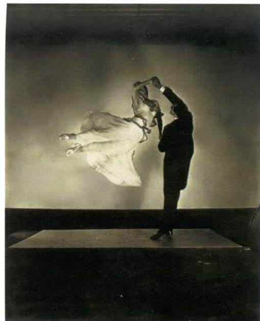
Antonio de Marco and Renée de Marco, The renowned ballroom dancing team, 1935 (Antonio de Marco y Renée de Marco, la célebre pareja de baile de salón)

En los años veinte, Steichen renunció al ideal del «arte por el arte» que había caracterizado su obra más temprana y declaró que la fotografía debía aspirar a ser algo más que «papel tapiz de gran calidad» para coleccionistas ricos. Aplicando sus habilidades en el ámbito comercial, se convirtió en figura pionera de la fotografía publicitaria moderna, al tiempo que revolucionó la fotografía de