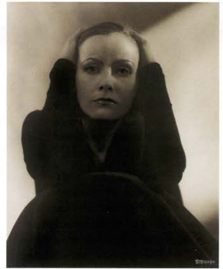
Greta Garbo, 1928

“Coincidiendo con esta gran retrospectiva dedicada a Steichen, en el Museo del Traje (Madrid) tiene lugar la exposición Edward Steichen, fotografía de moda (Los años de Condé Nast, 1923-1937) , desde el 25 de junio al 21 de septiembre de 2008”