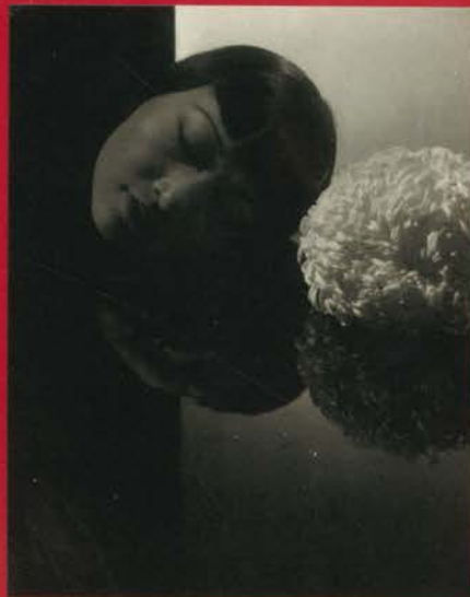
Anna May Wong, 1930

25 de junio de 2008 - 22 de septiembre de 2008