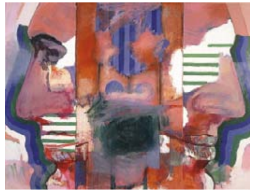
Dos perfiles , 1964. Óleo/lienzo. 89 x 116 cm. Colección particular

Luis Gordillo (Sevilla, 1934), recientemente galardonado con el Premio Velázquez 2007, máximo reconocimiento que hace el Estado Español a toda una trayectoria artística en el campo de las Artes Plásticas, es una de las figuras más influyentes del arte español en los últimos cuarenta años. Su carrera artística comienza a mediados de los años cincuenta. Tras licenciarse en Derecho y haber estudiado música, decide ser pintor y asiste durante dos años a la Escuela de Bellas Artes de Sevilla. En el verano de 1958 reside en París, cultivándose a fondo en museos, cine, lecturas..., pero sobre todo vive un clima de libertad entonces difícil en España. Amplia sus conocimientos sobre la vanguardia del momento, de manera especial, informalismo y arte geométrico. En 1959 vuelve a París, esta vez por dos años. Pinta según los parámetros informalistas, principalmente obras en tonos negros sobre blanco, siguiendo la brecha abierta por Michaux, Tàpies, Millares, Wols, etc.