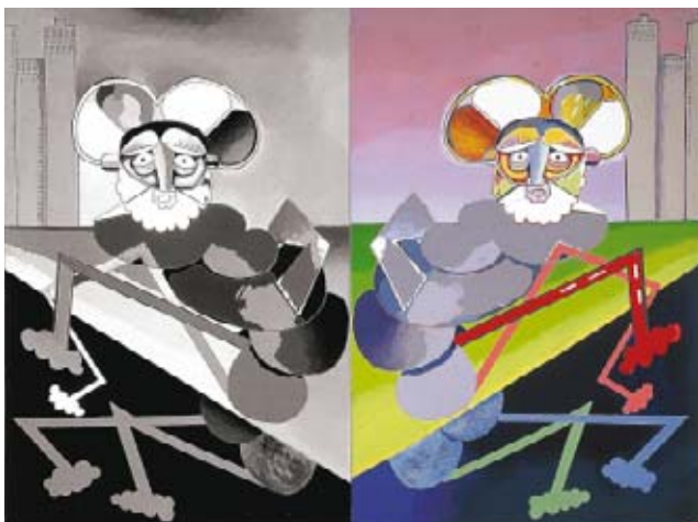
Gran veloz Iscariote Dúplex , 1974. Acrílico/lienzo. 150 x 200 cm Colección particular

Luis Gordillo siempre se ha implicado en la concepción de sus exposiciones antológicas. En esta ocasión ha desarrollado un proyecto expositivo muy diferente al realizado en su última gran retrospectiva celebrada en el Museu d'Art Contemporani de Barcelona, MACBA (2000). Más allá de la exhibición cronológica de piezas elegidas en función de su calidad, la muestra ha sido concebida como un espacio vivo, un campo dinámico de acciones y reacciones entre las obras, que sacude al espectador. Fiel a la idea de potenciar al máximo la activación de cuadros y espacios, y consciente, al mismo tiempo, del sentido didáctico que acompaña a una muestra antológica, Gordillo nos propone una exposición heterodoxa, muy singular, tratando de escenificar la tensión narrativa que ha caracterizado toda su trayectoria y convirtiendo la exposición en sí en una obra de arte más.