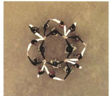
Ball de gitanes, 2007

La filmación en 16 mm de una serie de bailes sacados del repertorio de un grupo de danzas tradicionales es el punto de partida de este proyecto para el programa "Producciones" del Museo Nacional Centro de Arte Reina Sofía. Son danzas cuyo origen es incierto aunque la estructura como la conocemos hoy puede ser datada en el siglo XIX.