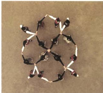
Ball de gitanes, 2007

Las formas ovoides como símbolo germinal, la circularidad, la rotación, el eje cielo-tierra, la luz y el color, son los elementos fundamentales con los que construye una sutil poética del universo, del sentido del espacio-tiempo, que despliega en múltiples direcciones y acrecienta con experiencias de otros lugares, como ha venido haciendo hasta ahora a través de sus viajes artísticos por México, Brasil, Europa, India o Japón, como si su misma trayectoria participase de un proyecto de dibujo global que se extiende por todo el planeta.