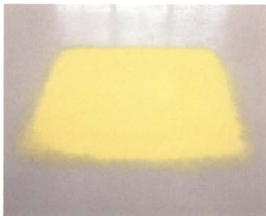
Pollen from Hazelnut (Polen de avellano)

Pollen from Hazelnut (Polen de avellano). Siguiendo el carácter procesual y ritual de su trabajo, durante los meses de primavera y verano el artista recolecta polen en los campos que rodean su casa en la Selva Negra en Alemania. Ordena el polen en simples frascos de cristal y para la instalación lo deposita directamente en el suelo, creando grandes cuadrados con un color de una intensidad fascinante.