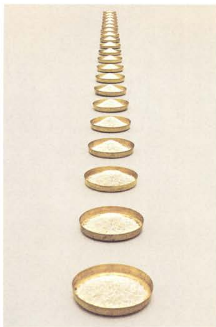
Rice Meals (Platos de arroz)

Milkstone (Piedra de Leche). Creada en 1975, consiste en un bloque rectangular de mármol blanco pulido con una ligera depresión en su cara superior. La pieza se rellena con una delgada capa de leche creando la ilusión de una forma sólida. Esta pieza requiere una participación casi ritual de mantenimiento diario. Laib realiza el primer acto de verter la leche cuando la obra está instalada, pero después de este gesto inicial el personal del museo tiene la responsabilidad de limpiar la piedra y verter la leche nueva cada mañana.