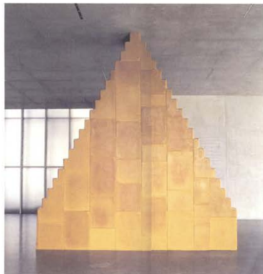
There is no Beginning and no End (No hay ni Principio ni Final)

Wolfgang Laib (Metzinger, Alemania, 1952) comenzó su trayectoria artística a mediados de los años setenta, tras finalizar estudios de medicina, profesión que sólo llegó a practicar en los primeros años. Perteneciente a una familia que había cultivado un exquisito ascetismo y realizado frecuentes viajes a la India y otros países de Oriente, se interesó desde muy joven por la religión y el misticismo, lo que le llevó a profundizar en las culturas y lenguas orientales y encontrar en el arte el medio de conocimiento y expresión de su visión del mundo. Desde entonces viene desarrollando un trabajo caracterizado por una gran pureza y austeridad formal. Se sirve de materiales naturales con una fuerte carga simbólica y vital, ajenos a los habituales en el arte, como la cera de abeja, la leche, el polen y el arroz para suscitar un encuentro entre arte, naturaleza y espiritualidad. Sus obras son concebidas como un ritual, un proceso íntegro conectado a un orden cósmico, a la mística de la naturaleza que han desarrollado diferentes culturas y religiones. Siguen un proceso cíclico en el que se trata de preservar