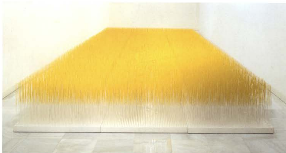
Jesús Rafael Soto. Extensión amarilla y blanca , 1979 Varillas de metal pintado y madera. 50 x 300 x 900 cm Museo Nacional Centro de Arte Reina Sofía