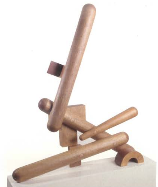
Gyula Kosice. Röyi , 1944 Madera articulada móvil. 120 x 80 x 25 cm Colección del artista