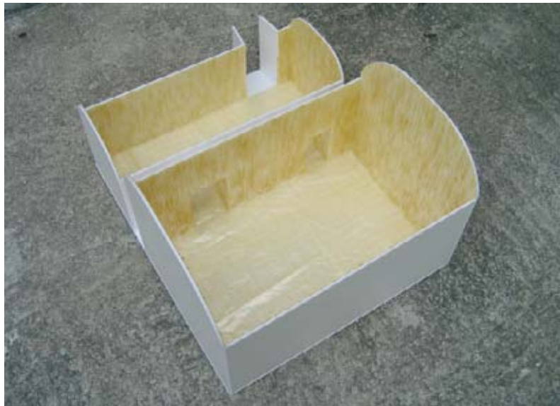
Maqueta de la instalación El peso de la ligereza . Museo Nacional Centro de Arte Reina Sofía, 2006