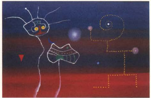
El primer consejo , 1950 Óleo sobre lienzo. 33 x 50 cm

En las Damas , los Autorretratos , los Retratos imaginarios , los montones de cabezas de las Multitudes , hay ojos por todas partes, miradas que emergen de los pliegues de la pintura. Es la mirada del pintor, aguda, intensa, inquieta, enfebrecida. Remite al espectador a su pintura llenándole de turbación. Antonio Saura definió una moral en la pintura. Esa pintura que él concebía como una "secreción natural del ser humano".