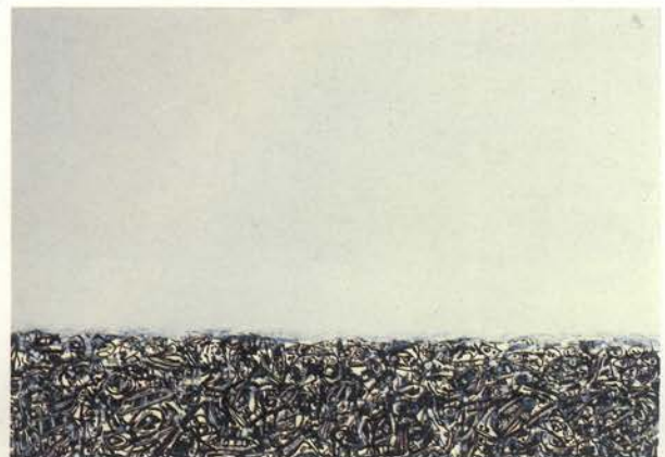
Multitud , 1959 Óleo y tinta china sobre papel. 62,6 x 90,3 cm

¿Cómo llega la imagen al cuadro? Ésa es la pregunta que parece plantear su pintura desde sus principales temas, que en adelante desarrollará sin cesar: los Retratos Imaginarios , los "perros de Goya", las Multitudes , las Crucifixiones... A partir de mediados de los años cincuenta aparecen en su obra algunos esquemas figurativos que pronto serán los suyos, evocando sobre