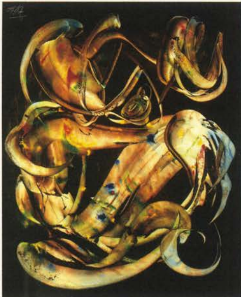
La esfinge , 1955 Óleo sobre lienzo. 100 x 80 cm

Su primera exposición tuvo lugar en 1950 en la librería Libros de Zaragoza. Al año siguiente realiza su primera exposición individual en Madrid, en la galería Buchholz, con el título Pinturas surrealistas de Antonio Saura . En el catálogo, se incluye a sí mismo entre los "pintores del misterio" y propone "atender con preferencia a las primeras llamadas automáticas, que son siempre las más valiosas". La variedad experimental de trabajos anteriores desapareció para concretarse en la minuciosa conformación de un azaroso punto de partida. Manchas depositadas con presteza sobre fondos nocturnos eran conformadas lentamente, ordenándose en espacios ilimitados, mostrando una solución personal dentro de la órbita surrealista.