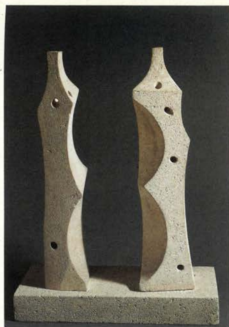
La tierra y la luna , 1955. Piedra caliza. 80 x 59 x 25 cm Colección particular, Madrid

En 1957 recibe el Premio Internacional de Escultura en la IV Bienal de São Paulo con 28 esculturas presentadas en familias experimentales; también edita un catálogo con el texto Propósito experimental, 1956-57 , en el que fundamenta los principios teóricos de su obra. Tras São Paulo, Oteiza reflexiona sobre el progresivo papel del vacío y el silencio que encuentra en su escultura. Formula en esta época la