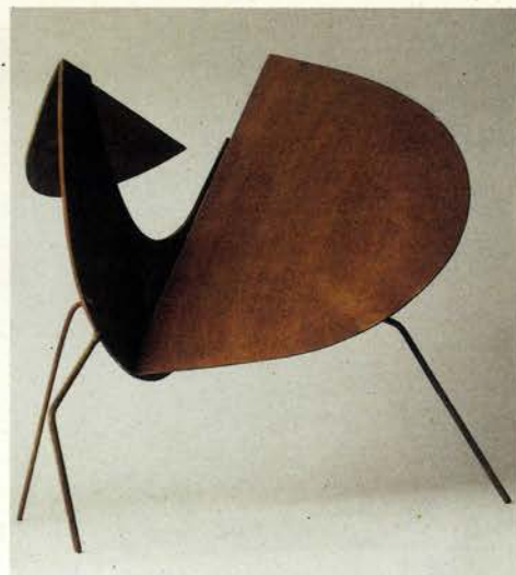
Flotación (Escultura lunar) , 1957-58 Acero. 32,5 x 39 x 30 cm Fundación Museo Jorge Oteiza Fundazio Museoa

Organizada de acuerdo con un criterio que sigue de cerca su proceso experimental a fin de plasmar la evolución formal y conceptual del artista, la exposición Oteiza: mito y modernidad reúne aproximadamente doscientas obras procedentes de museos y colecciones particulares.