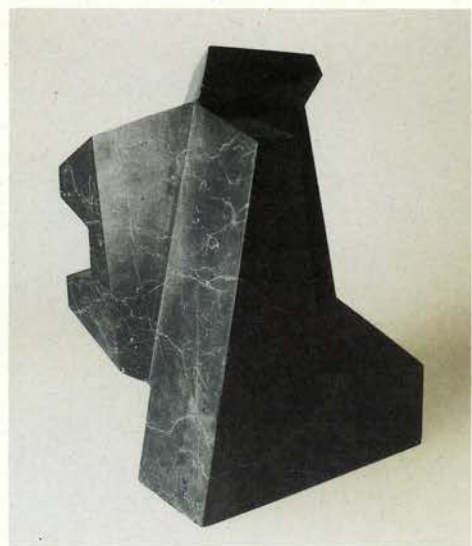
Las Meninas (Lo convexo y lo cóncavo, el perro y el espejo) , 1959 Mármol. 42 x 30 x 25,5 cm Fundación Museo Jorge Oteiza Fundazio Museoa