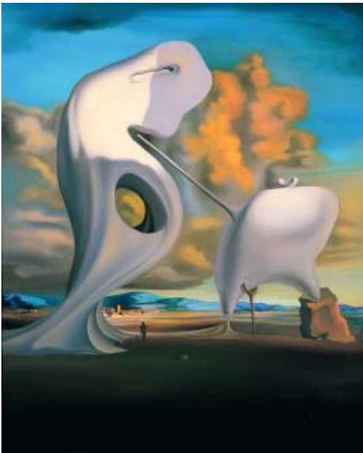
Salvador Dalí. El Ángelus arquitectónico de Millet , 1933 Óleo sobre tela, 73 x 61 cm Museo Nacional Centro de Arte Reina Sofía

La exposición que presentamos, organizada con motivo del centenario de Salvador Dalí, trata precisamente de estas relaciones entre el arte y el no-arte (la cultura de masas), un aspecto crucial en la obra del pintor, pero también un tema de vital importancia para todos los artistas del siglo XX. Las conexiones que se establecen entre los dos universos mencionados, las ósmosis que se generan y las igualaciones resultantes, son tratadas a través de ocho espacios: