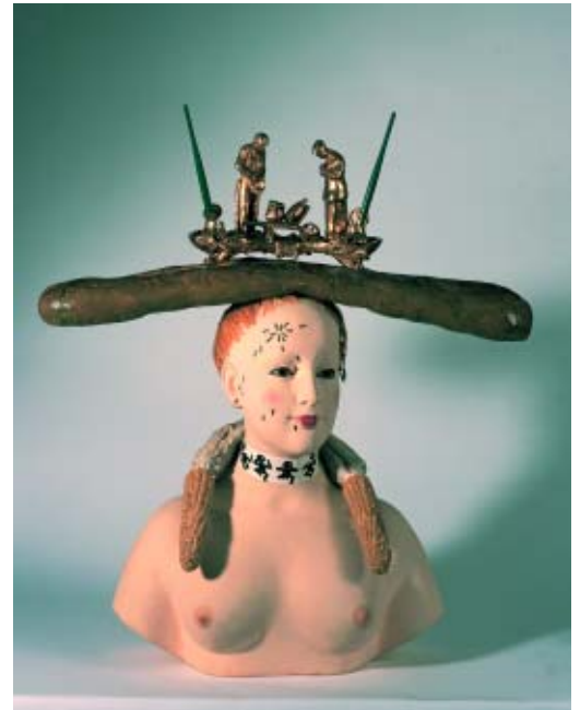
Salvador Dalí, Busto de mujer retrospectivo , 1933 (reconstruido en 1970) Assemblage, 74,5 x 67 cm Fundación Gala-Salvador Dalí, Figueres

EPÍLOGO. Se finaliza el recorrido con dos screen tests —retratos cinematográficos— que Andy Warhol hizo de Dalí en los años 1965 y 1966. Una prueba de la amistad entre estos dos creadores, de generaciones, orígenes y resultados artísticos muy diferentes, pero, por otra parte, coincidentes en tantas cosas.