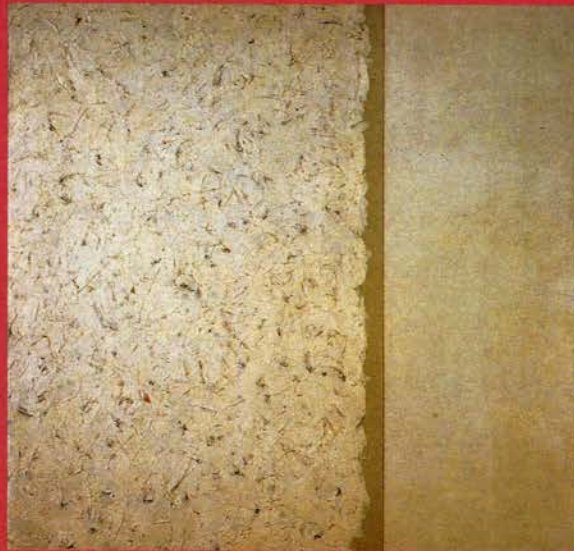
Robert Ryman. Untitled (Sin título) , 1960 Óleo / lienzo de algodón en dos paneles, 166 x 165,5 cm Stedelijk Museum of Modern Art, Amsterdam Inv. A 34644

15 de junio a 6 de septiembre de 2004 Planta 1ª (Sala A1)