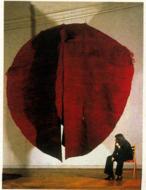
Magdalena Abakanowicz. Abakan Red ("Abakan" rojo), 1969 Sisal, 400 x 400 x 350 cm. Magdalena Abakanowicz, depósito en el Museo Nacional de Wrocław.

La exposición invita a reflexionar sobre la percepción de la obra de arte actual. No existen explicaciones académicas sobre lo que cada espectador experimentará subjetivamente porque no podemos conocer la mente de los demás. Por eso, la exposición finaliza con una instalación del joven italiano Roberto Pietrosanti cuyas dimensiones están inspiradas en los lugares de encuentro de los etruscos, donde la gente se reunía para abandonarse a la contemplación. Antes de entrar, el espectador debe quitarse los zapatos, un acto ritual en el espíritu de la visión transformadora de los artistas de la exposición. Una vez dentro, el espectador puede reflexionar sobre lo que ha experimentado. En ese momento, sólo se escucha el sonido de la exposición: el canto quejumbroso de los sefardíes, la cultura creada por los musulmanes y los judíos que, en otro tiempo, construyeron una esplendorosa civilización de progreso en España.