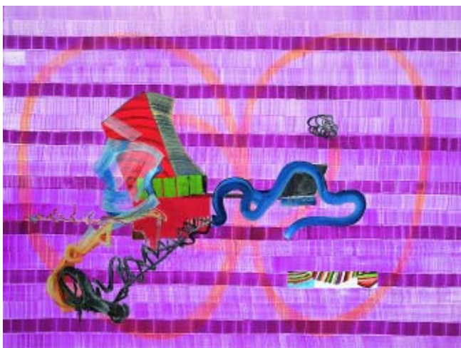
Fragmentos de Felipe IV, 2000-2001 Vinílico, dispersión y pigmentos sobre lienzo. 203,2 x 274,3 Colección particular. Cortesía Galería Marta Cervera