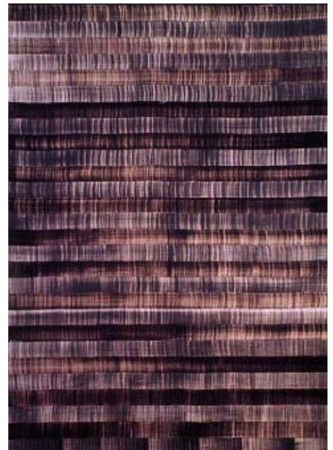
Soñe que revelabas XIII, 2002 Óleo sobre lienzo. 275 x 203 cm Galería Thomas Schulte, Berlín

La exposición, organizada por el Museo Nacional Centro de Arte Reina Sofía y comisariada por Enrique Juncosa, incluye unos ochenta cuadros y una treintena de fotografías de los diez últimos años de su trayectoria. Presentada de forma temática y no cronológica, la muestra está dividida en siete apartados: 1- Eolo. 2- Celibataires. 3- Gramaland y luz aislada. 4- Soñe que revelabas. 5- In Urbania. 6- Rizomas. 7- Llerana y tira matamoscas.