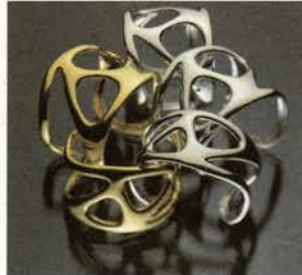
Joaquín Berao Conjunto de brazaletes de oro. Colección Cabur Colección 2000

Tras estos espejos descubriremos que, además de una realidad empresarial, la moda española es también reflejo del momento cultural y creativo de nuestra sociedad, y como tal plural y compleja.