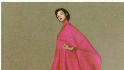
Sybilla Vestido Torero Colección otoño-invierno 2001-2002 Cliente: Proesa