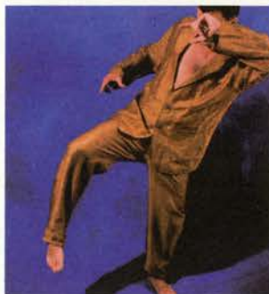
Adolfo Domínguez Traje años 80 Colección primavera-verano 1986