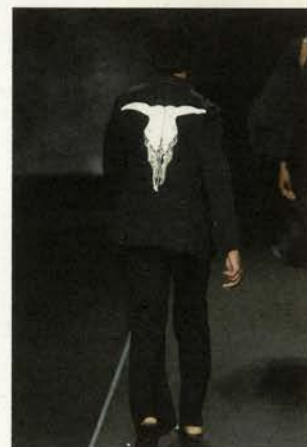
Roberto Verino Traje inspiración Georgia O'Keeffe Colección primavera-verano 2003