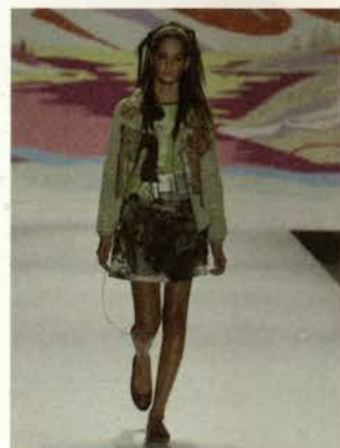
Custo Barcelona (Custo Dalmau) Sin título Colección otoño-invierno 2003-2004 Cliente: Blue Tower