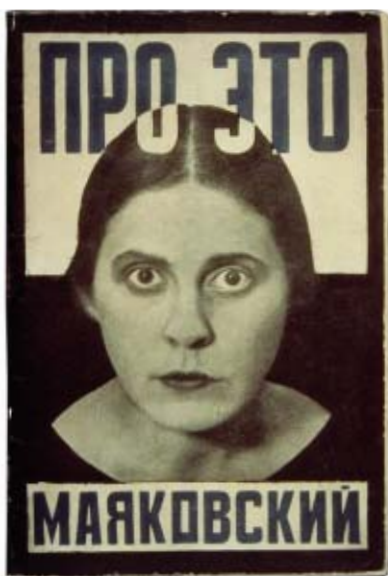
Alexander Rodchenko Sobre esto: para ella y para mí, de Vladimir Mayakovsky Moscú, Gosudarstvennoe izdatel'stvo (Editora Pública), 1923. Impresión tipográfica, 23 x 15,1 cm.

La exposición muestra cerca de 350 libros rusos editados entre 1910 y 1934, seleccionados entre los más de mil volúmenes que la Judith Rothschild Foundation ha donado el pasado año al Museum of Modern Art (MoMA) de Nueva York. Entre ellos se incluyen los hectografiados (la mayor colección del mundo), libros infantiles, libros en yidish, libros de artista, junto a publicaciones gráficas, literarias, especializadas, o propagandísticas. Algunos de ellos son extremadamente raros, debido a las circunstancias en las que se crearon (revolución rusa y guerra civil) y a la persecución posterior de la vanguardia por el estalinismo.