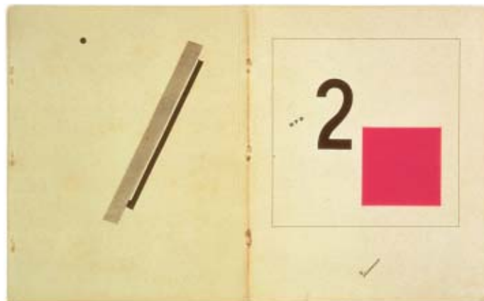
El Lissitzky De dos cuadrados: cuento suprematista en 6 construcciones, de El Lissitzky, 1922. Scythians, Berlín Impresión tipográfica, 27,9 x 22,5 cm. © 2003 Estate of El Lissitzky/ARS, Nueva York / VG Bildkunts, Berlín

A finales de los años veinte e inicios de los treinta, los principios del diseño constructivista se extendieron a todo tipo de publicaciones, desde las revistas de arquitectura a los catálogos comerciales y los informes del gobierno. Tal como se ilustra en la última parte de esta exposición, titulada Construyendo el socialismo , estas manifestaciones gráficas muestran un creciente empleo del fotomontaje al servicio de la propaganda. Sobre todo Gustav Klutis, pero también Lissitzky y Rodchenko, desarrollaron un estilo "de agitación" en libros y revistas de tiradas masivas. A medida que aumentaban los controles sobre la expresión artística, los artistas se vieron obligados a cultivar temáticas que ensalzaban los logros soviéticos, dirigidas tanto al público nacional como extranjero. Finalmente, en 1934, Stalin decretó que sólo el realismo socialista, con su glorificación emotiva de los objetivos soviéticos, podía ser tolerado en las artes. Se cerraba abruptamente, de este modo, un periodo fundamental de la producción de vanguardia, iniciado en 1910 con una audaz afirmación de libertad creativa.