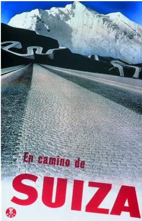
Herbert Matter , En camino de Suiza , Cartel para la Oficina de Turismo Suiza, 1935 Huecograbado y tipografía / papel. 101 x 64 cm Museum für Gestaltung Zürich, Plakatsammlung

Esa tendencia al arte sistemático, limitado a las leyes y medios propios (es decir, planos y colores), riguroso en su idea y en su ejecución, define el llamado arte concreto suizo, cuyos representantes se hallaban cercanos a los presupuestos constructivistas, a la Bauhaus y al grupo Abstraction - Création. Pese a ello puede distinguirse una tendencia más intuitiva, visible sobre todo en las obras primeras de los principales artistas -Max Bill, Verena Loewensberg, Camille Graeser, Richard Paul Lohse- frente a otra más sistemática y geométrica que gana terreno en su obra de posguerra. Sophie Taeuber-Arp, profesora en la Escuela de Artes y Oficios de Zurich, representa aquí a artistas de una generación anterior que influyeron en ellos, como Hans Arp, o los profesores de la Bauhaus Paul Klee y Johannes Itten.