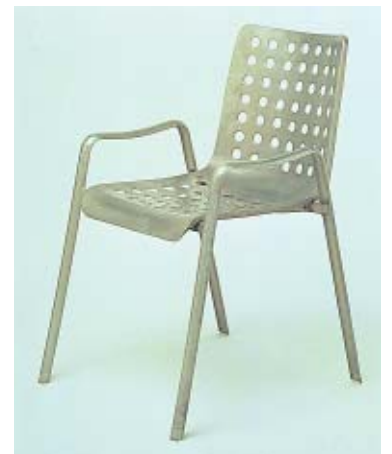
Hans Coray, Silla Landi, 1939 Producción MEWA Blattmann. Silla apilable de aluminio para exteriores. Museum für Gestaltung Zurich, Design-Sammlung

En el ámbito de la fotografía destacan dos aspectos. Por una parte la visión objetiva, moderna e industrial de los pioneros Hans Finsler y Anton Stankowski (formados en Alemania), y por otra la creación de una nueva imagen de identificación del país -en la que naturaleza, técnica y hombre se dan la mano- visible en la fotografía publicitaria de Herbert Matter. En ambos terrenos existe una gran libertad y afán de experimentación técnica y formal, que permitió una fértil colaboración tipofotográfica entre diseñadores y fotógrafos.