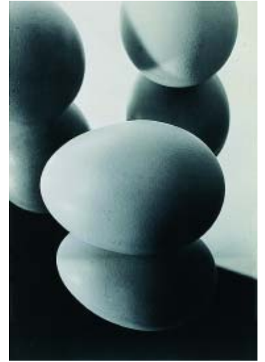
Hans Finsler , Eier im Spiegel II (Huevos ante un espejo II), antes de 1929 Gelatina de plata /papel. 36,6 x 24,3 cm Schweizerische Stiftung für die Photographie

En los años sesenta el poderoso y coherente movimiento colectivo iniciado a mediados de los años veinte en Suiza en torno a la arquitectura funcional y al arte abstracto de orientación constructiva fue disolviéndose, y sus protagonistas se concentraron en su propia obra trabajando de manera más individualista. Una nueva generación, de la que dan fe las páginas de Spirale , continuó sus enseñanzas. Pero también en esas páginas aparecen signos de rebelión entre aquellos como Dieter Roth que, aún reconociendo las enseñanzas constructivas, se revelaban contra el rigor racionalista de las mismas, y sus limitaciones. Pero el intento de crear "algo original y duradero, no algo novedoso y transitorio" tiene en el esfuerzo realizado por los artistas presentes en esta exposición uno de sus hitos colectivos más logrados, y halla su continuidad en las experiencias ópticas, cinéticas, y minimalistas posteriores.