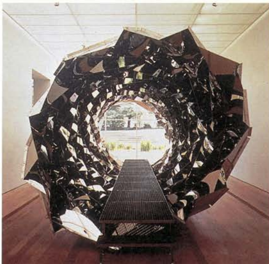
Your spiral view (vista de la instalación), 2002 Acero inoxidable. 800 x 320 x 320 cm Fundación Beyeler, Riehen/Basel

El catálogo, editado para la ocasión, insiste en estos dos aspectos: por un lado se recoge mucha información visual sobre la tradición arquitectónica a la que pertenece el edificio: orangeries , pabellones, casa de cristal, invernaderos..., pasando por la historia de los edificios efímeros, y por otro lado, la idea de producir un cierto clima en el interior de un espacio. El catálogo, además, cuenta con textos del artista y del sociólogo Jens Schrub-Hansen.