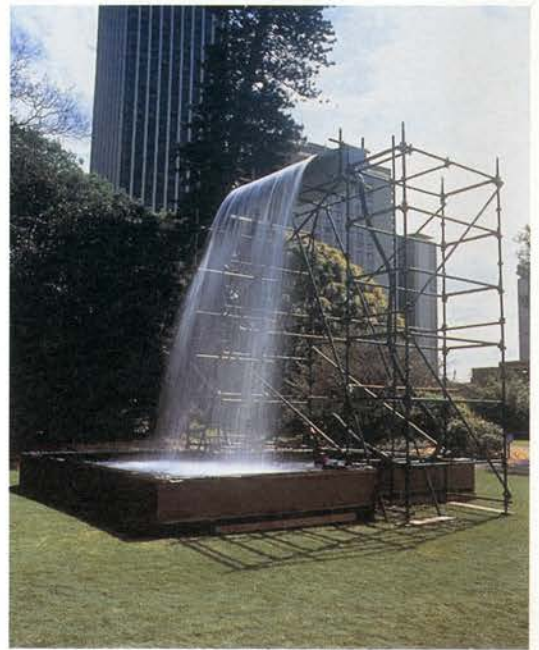
Cascada (vista de la instalación, Bienal de Sidney), 1998

Danés de nacimiento pero de madre islandesa, residente en Berlín pero profesor a tiempo parcial en Venecia, Olafur Eliasson (Copenhague, 1967) ejemplifica bien el modelo de artista cosmopolita europeo, cuyos intereses intelectuales provienen de las fuentes más diversas, y cuya obra no se explica, a pesar de unas características probablemente nórdicas –su especial relación con el paisaje –, dentro de los parámetros de ninguna escuela nacional. En los últimos años, en cualquier caso, su obra se ha visto en los museos más importantes del mundo, desde el MOMA de Nueva York al Musée d'Art Moderne de la Ville de París, pasando por el Art Institut de Boston, el Irish Museum of Modern Art de Dublín o el ZKM (Zentrum für Kunst und Medientechnologie) de Karlsruhe. Después de la presentación de su obra en Madrid, Eliasson representará a Dinamarca en la próxima Bienal de Venecia, expondrá en la Menil Collection de Houston, y realizará la próxima intervención en la Sala de las Turbinas de la Tate Modern de Londres.