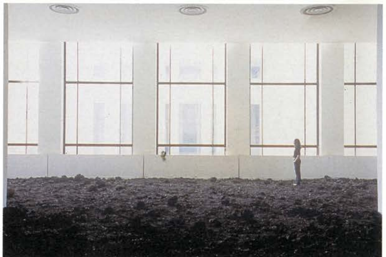
Suelo de lava (vista de la instalación), 2002 Piedras de lava. Dimensiones variables. Musée d'Art Moderne de la Ville, París