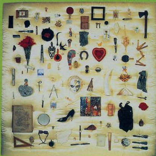
Autorretrato, 1994 Técnica mixta, Diferentes objetos, 200 x 200 cm Colección de la artista

24 de octubre de 2002 a 14 de enero de 2003