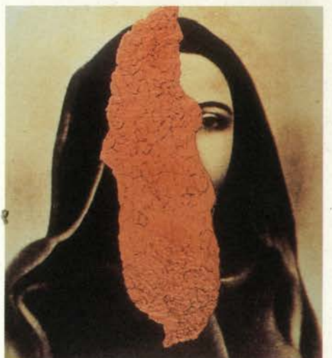
Corona Boreal , 1999 Técnica mixta. Collage y fotografía, 137 x 122 cm Colección Arte Contemporáneo. Museo Patio Herreriano, Valladolid