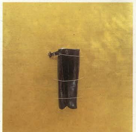
Marcha fúnebre , 1998. Técnica mixta. Collage y oro, 80 x 80 cm. Colección privada