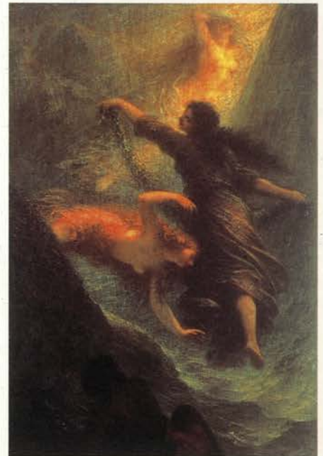
Henri Fantin-Latour, Escena primera de El oro del Rhin de Richard Wagner, 1888. Óleo/tela. 116,5 x 79 cm Hamburger Kunsthalle, Hamburgo

Antoni Gaudí es uno de los máximos exponentes del modernismo arquitectónico. Nació en Reus (Tarragona), en 1852, en el seno de una familia de artesanos. Cursó sus estudios de arquitectura en Barcelona y la mayor parte de su trabajo fue realizado en esta ciudad. Entre sus obras más emblemáticas se encuentran La Sagrada Familia, La Pedrera, Casa Milá, Casa Batlló y el Parque Güell. Murió a los 74 años atropellado por un tranvía. Su cuerpo fue enterrado en la cripta de La Sagrada Familia, la obra a la que dedicó las cuatro últimas décadas de su vida.