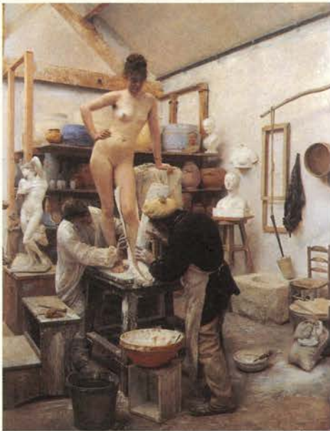
Édouard Dantan, Vaciado en yeso del natural , 1887 Óleo/tela. 165 x 131,5 cm Göteborgs konstmuseum, Gotemburgo

La exposición se estructura en tres secciones que no guardan una sucesión cronológica, sino que planteadas como estancias mentales nos sitúan frente a la diversidad y densidad del universo gaudiniano. Compuesta por cerca de 400 obras, los materiales originales de Gaudí se exhiben junto a un amplio repertorio de obras y documentos de otros artistas con el objetivo de acercarnos a la singularidad creativa de este arquitecto, enmarcándola en el contexto de su tiempo.