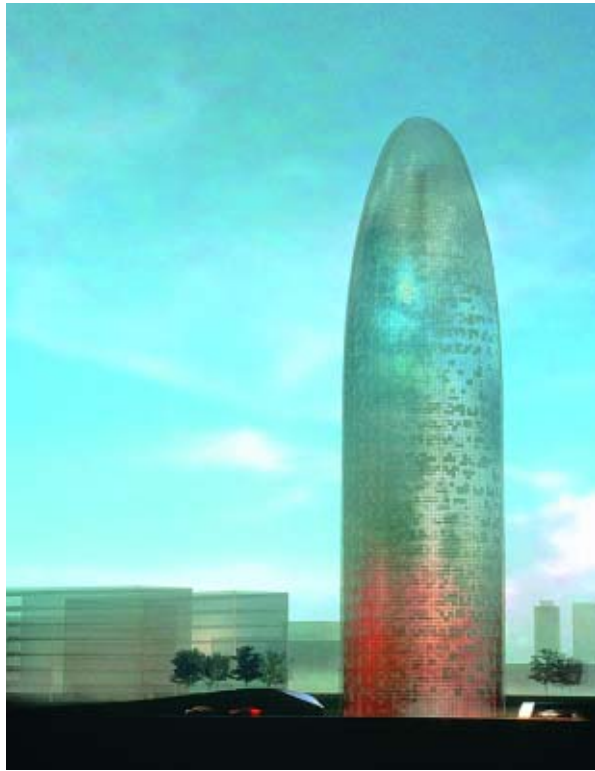
Torre de aguas, Barcelona, 1999. Con B-720 Proyecto en curso. Imagen de síntesis © Artefactory. © Jean Nouvel, VEGAP, Madrid, 2002

La sexta secuencia nos ofrece la reconstrucción de la agencia de Nouvel, es la única sala iluminada de la exposición. Distribuidos en mesas, varios monitores permiten al público consultar los archivos, los ficheros y los bancos de datos de la agencia. Son casi doscientos proyectos concebidos desde hace unos veinte años, que se pueden consultar y que aparecen repartidos en cinco secciones: los proyectos que se están realizando, los proyectos urbanos, las escenografías, las realizaciones y los proyectos no realizados, como el acondicionamiento del parque de la Villette (París, 1982), la Mediateca y el Centro de Arte Contemporáneo de