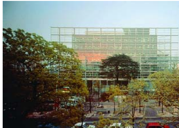
Fondation Cartier pour l'art contemporain París, 1991-1995 Jean Nouvel et Emmanuel Cattani

También se distinguen algunos conjuntos, como por ejemplo el museo del Quai Branly (París, 1999) que se encuentra en construcción en este momento; las últimas etapas de la desmaterialización, donde la materia cada vez se hace más invisible: la Dentsu Tower de Tokio (Japón, 1998-2003), la Cámara de Comercio de Prato (Italia, 2000), la Sala Filarmónica de Luxemburgo (Ducado de Luxemburgo, 1997), la Torre BIS de Basilea (Suiza, 1999) y Kyriat Arieh 1 en Tel Aviv (Israel, 1999); los numerosos proyectos americanos, como por ejemplo el River Hotel de Brooklyn (Nueva York, USA, 1999), y los que se están estudiando en este momento, como el Carnegie Science Center de Pittsburgh (USA, 2001), el Soho Hotel de Nueva York (USA 2001-2002), así como el reciente proyecto Landmarck en Nueva York (USA,