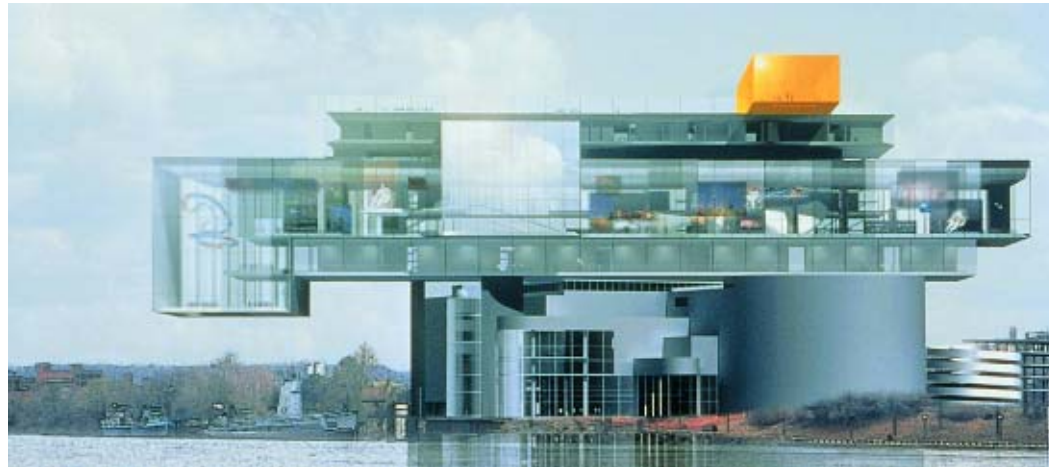
Carnegie Science Center, Pittsburgh (USA), 2001 Proyecto en curso. Imagen de síntesis © Artefactory © Jean Nouvel, VEGAP, Madrid, 2002

Nîmes (Gard, 1984), el Nuevo Teatro Nacional de Tokio (Japón, 1986), la Tour sans fins , el Triangle de la Folie , (París, La Défense, 1989-1994) y el Halo de la Flèche en Salzburgo (Austria, 1989).