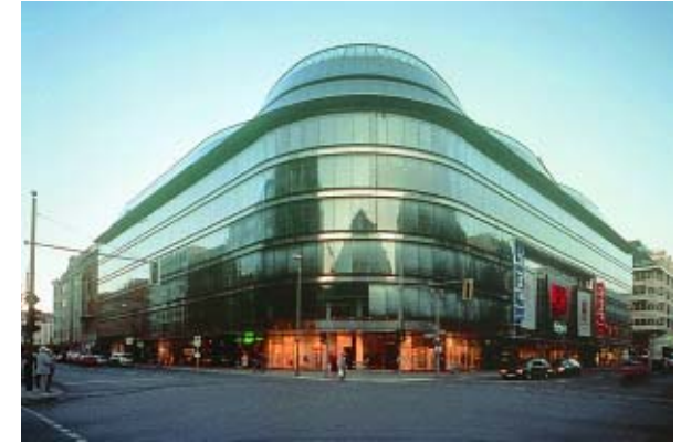
Galerías Lafayette, Berlín (Alemania), 1991-1995 Jean Nouvel et Emmanuel Cattani