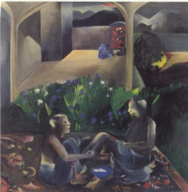
Seva , 1986 Óleo sobre tela. 117 x 112 cm Colección del artista