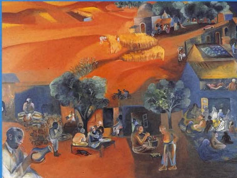
The Goldsmith (El orfebre), 1997, Óleo sobre tela. 180 x 240 cm Museo Nacional Centro de Arte Reina Sofía

6 de junio a 16 de septiembre de 2002 Planta 3ª