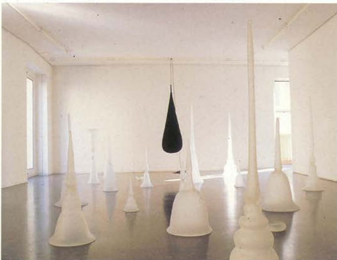
Como el silencio de una gran orquesta , 1995-96 Museo Nacional Centro de Arte Reina Sofía

Eva Lootz se interesa por las características físicas de distintos materiales, como la parafina, el mercurio y la arena, además de por las ciencias desarrolladas en torno a ellos como la metalurgia, la geología o la minería. Desde estas observaciones realiza esculturas que, sin embargo, se refieren a cuestiones de tipo lingüístico o filosófico. A partir de los años ochenta, comienza a producir una serie de instalaciones creando recintos o habitáculos que nos hablan del cuerpo como arquitectura del alma. Sus imágenes características – zapatos, nudos, lenguas, capuchas...- se convierten en espoletas para las más libres asociaciones psicológicas.