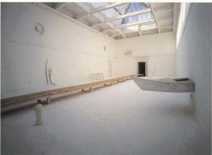
Farewell to Isaac Newton . Instalación, South London Gallery, 1994 Col. MEIAC, Badajoz