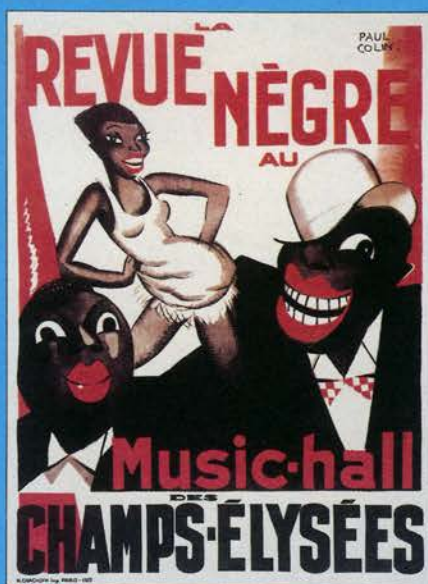
Paul Colin, La Revue Nègre , 1925 157 x 117 cm. Bibliothèque Nationale de France, Paris

14 de noviembre de 2001 a 21 de enero de 2002