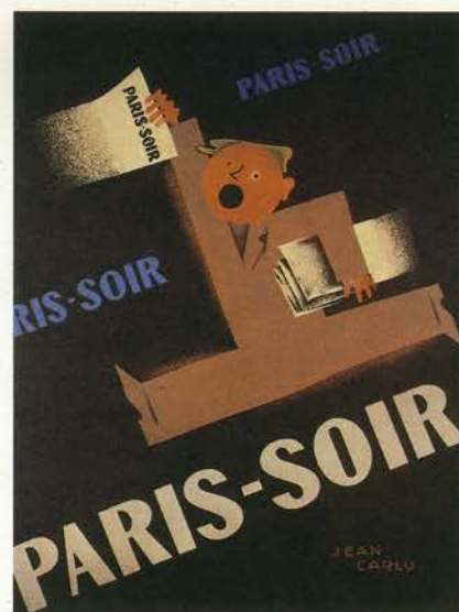
Jean Carlu, Paris-Soir , 1928.

En la muestra se presentan algunas de las imágenes que, durante más de cuatro décadas, animaron el paisaje urbano de París y constituyeron el telón de fondo de la vida de sus ciudadanos: desde el cartel de la mítica Revue Nègre -que dio a conocer a Josephine Baker, al que incitó a viajar a Nueva York a bordo del paquebote Normandie y, también, aquellos que, en la década de los cincuenta, mucho tiempo después de la aparición del cubismo, insistieron en las formas geométricas rígidas y en las líneas dinámicas para invitar a degustar el aperitivo Saint Raphaël, los vinos Nicolas o el agua de Vichy.