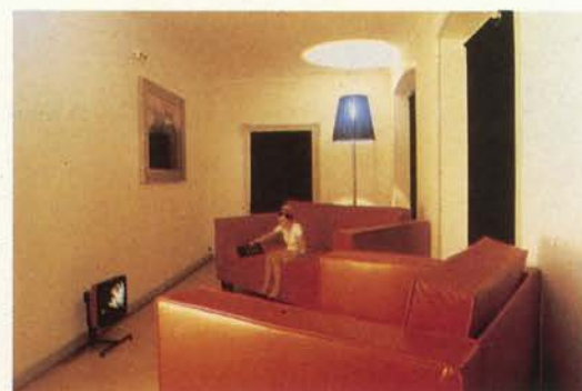
Das Zimmer (The Room) , 1994/2000 Vídeo instalación, Kunstmuseum St Gallen, 1994.

Una sílfide salpicada de piedras preciosas de colores sueña con su nacimiento. La situación es captada con una minúscula cámara de vigilancia de 4 cm que vuela como un helicóptero sobre sus manos de 100 m de altura.