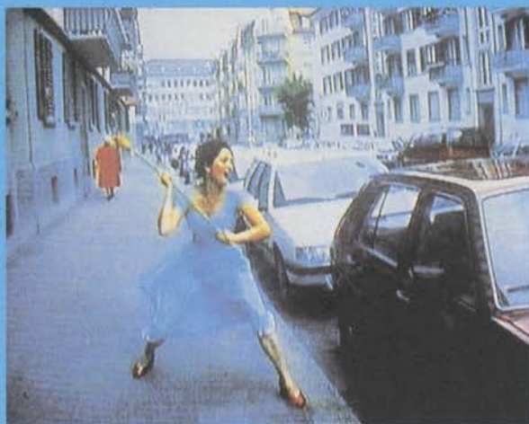
Ever Is Over All , 1997. Fragmento video instalación

4 de octubre de 2001 a 2 de enero de 2002