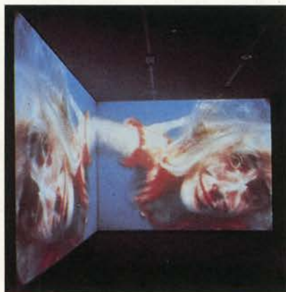
Sip My Ocean , 1996 Vídeo instalación Guggenheim Museum Soho New York, 1998

Grabada casi por completo debajo del agua, Sip My Ocean ofrece una mirada "ojo de pez" de jardines de algas oscilantes y reinos de coral. Moviéndose como una sibarita sobre el fondo del océano la cámara graba las trayectorias de los objetos domésticos mientras se hunden en las profundidades del mar. (Nancy Spector, Parkett 48, 1996)