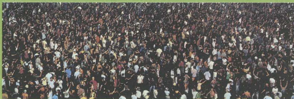
May Day IV, 2000 (Primero de Mayo IV) 200 x 500 cm.

12 de julio a 23 de septiembre de 2001 Palacio de Velázquez