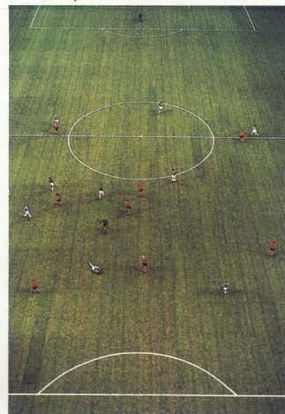
EM, Arena, "Amsterdam I", 2000 (Estadio EM, Amsterdam I) 280 x 200 cm

Andreas Gursky nació en Leipzig, en 1955, y creció en Düsseldorf, donde vive y trabaja. Su padre, un fotógrafo comercial de éxito, le inició en la fotografía. A finales de los años 70 estudió en la Folkwangschule, de Essen y, a principios de los años 80, en la Kunstakademie de