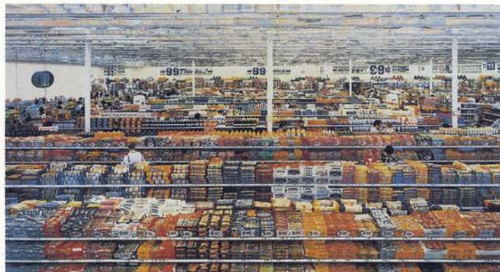
99 Cent, 1999 (99 centavos) 207 x 337 cm.

La publicación que la acompaña, ha sido posible gracias al John Szarkowski Publications Fund.