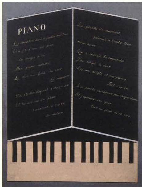
Piano , 1922 Collage, gouache/papel. 61,5 x 47 cm IVAM, Instituto Valenciano de Arte Moderno

Se considera a Vicente Huidobro (Santiago de Chile, 1893 - Llolelo, Chile, 1948) como el primer poeta de vanguardia en lengua castellana. En sus primeros libros, La estrella de Andocollo y Ecos del alma , editados, respectivamente, en 1910 y 1911, se reflejó la influencia de la poesía simbolista y modernista. En 1912, fundó la revista Musa Joven y, al año siguiente –junto a Pablo de Rokha que llegaría a ser otro de los grandes poetas de vanguardia chilenos–, Azul . Ambas publicaciones siguieron las pautas de las mencionadas tendencias y, en consecuencia, ofrecieron en sus páginas textos de destacadas figuras de la misma, como Rubén Darío, Azorín, Pío Baroja, Ramón del Valle Inclán, Juan Ramón Jiménez y Gabriele d'Annunzio. En 1913 publicó Canciones en la noche , libro en el que incluyó varios poemas caligramáticos, hoy considerados como un antecedente de los de Guillaume Apollinaire. Tres años después, en plena Primera Guerra Mundial, se instaló en París y allí entró en contacto con escritores y artistas adscritos al cubismo, entre otros, con el propio Guillaume Apollinaire, Juan Gris, Pablo Picasso, Max Jacob, Jacques Lipchitz, Diego Rivera, Jean Cocteau, Pierre Albert-Birot, Paul Dermée y Pierre Reverdy –con el que fundaría la revista Nord-Sud –. En 1918 viajó a Madrid donde conoció y trabajó con