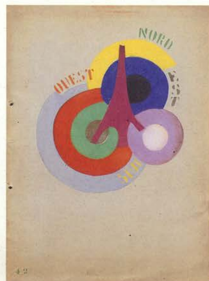
Tour Eiffel Imprenta Pueyo. Madrid, 1918 Fundación Vicente Huidobro, Santiago de Chile