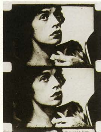
Cocksucker Blues , 1972

En su trabajo posterior, basado en la idea de que sólo un proceso intuitivo de percepción personal puede crear las condiciones previas para un proceso de percepción, Robert Frank desarrolló una obra compleja y autobiográfica.