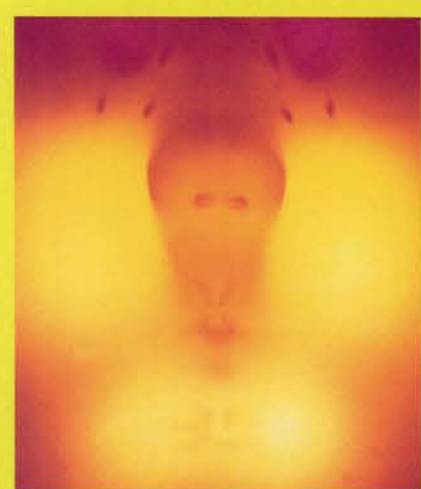
A. PALATNIK, OBJETO CINÉTICO

artística en el ámbito geográfico del continente americano. Las exposiciones que conforman este proyecto, comisariadas individualmente, son, en su concepto, únicas, pero a la vez también están