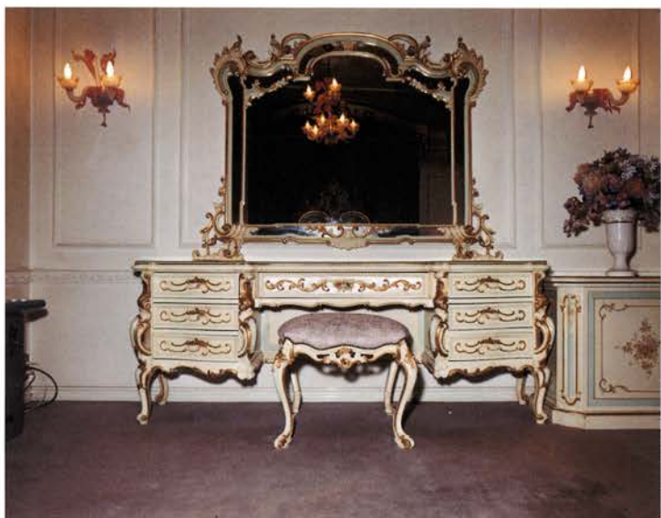
locador 4, 2000, (176 x 225 cm)

Museo Nacional Centro de Arte Reina Sofía