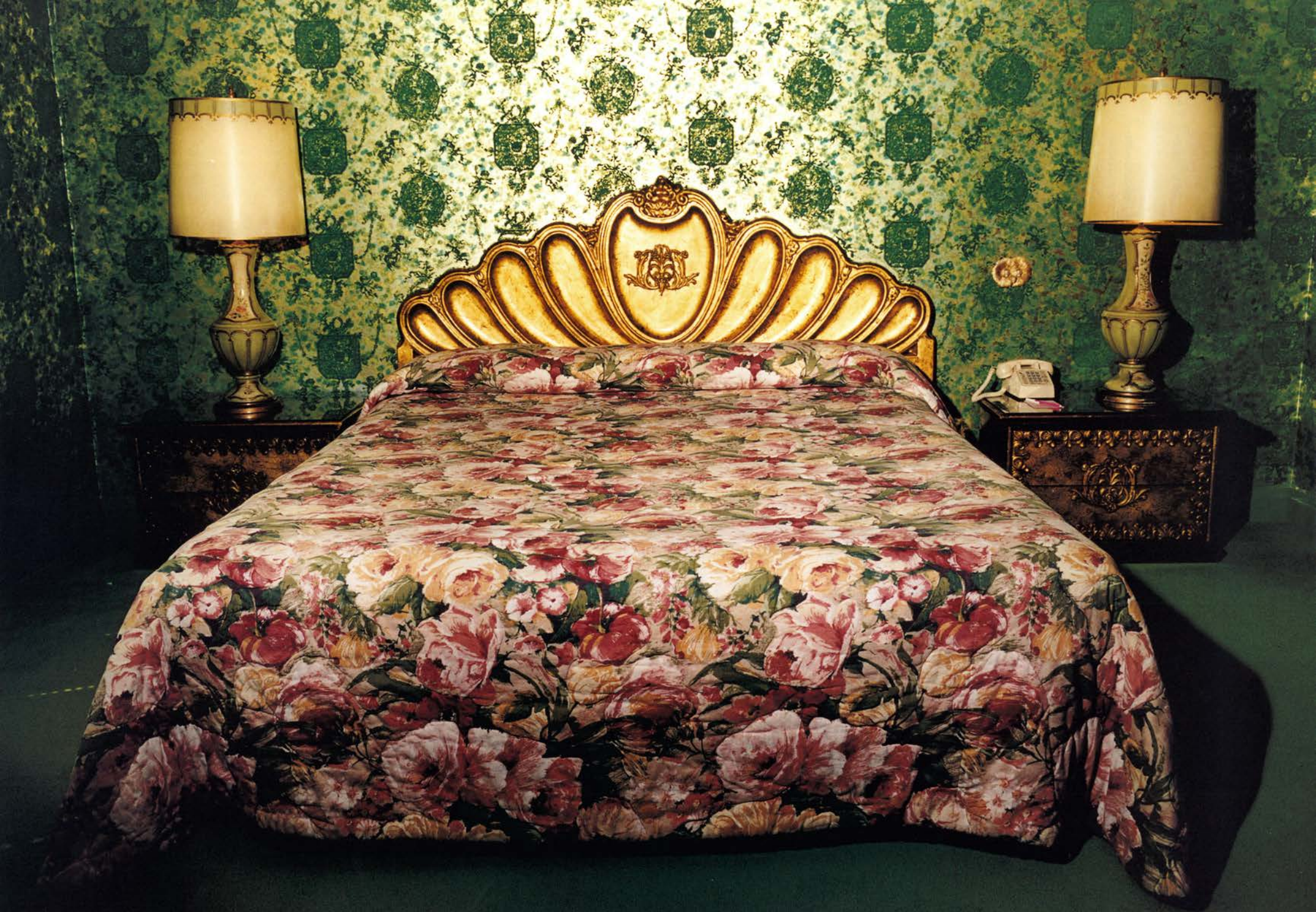
Habitación 15, 1999, (176 x 225 cm.)