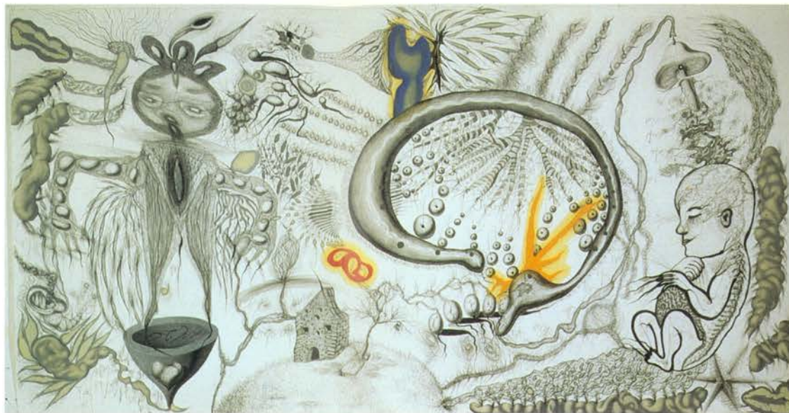
Olorenis Dasid (1991)